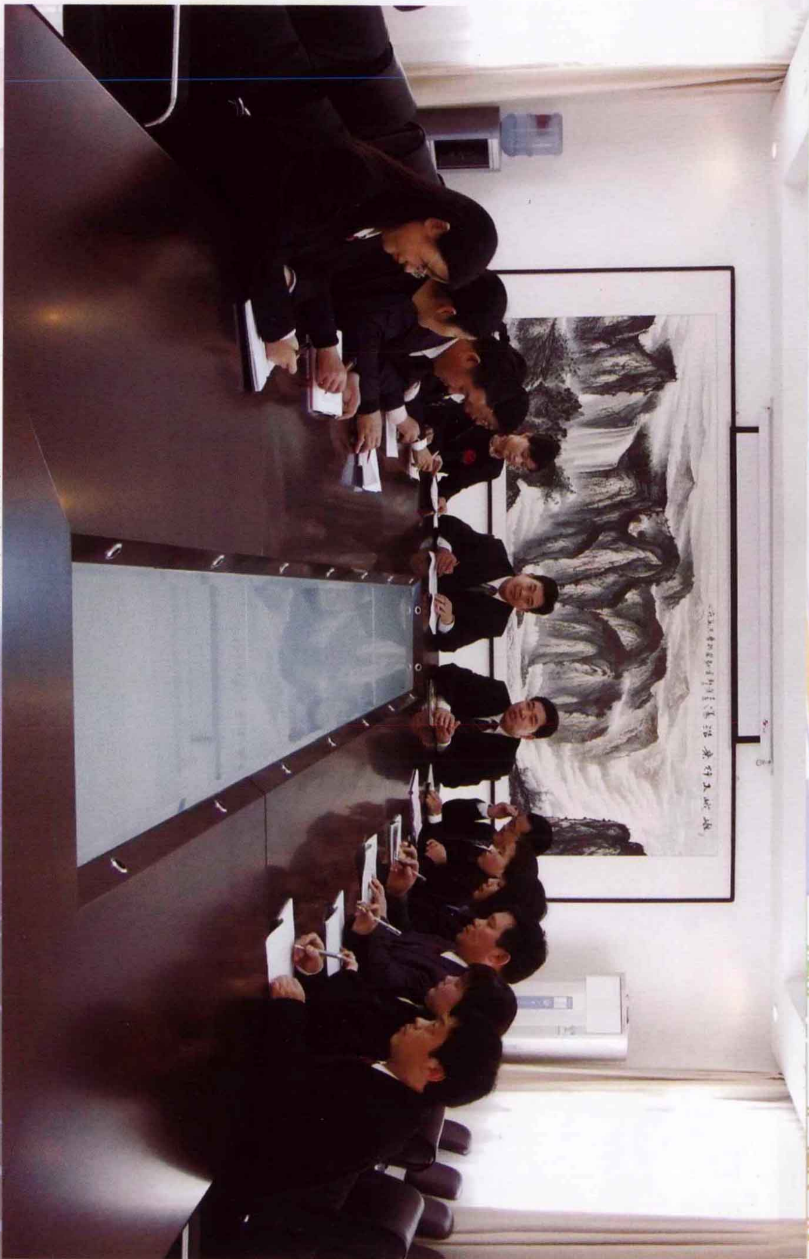
街道办事处班子成员在研究工作