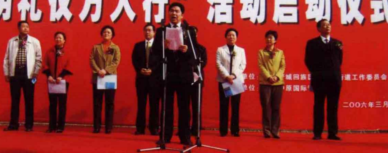
街道党工委书记郑向阳在“文明礼仪万人行”活动启动仪式致开幕词