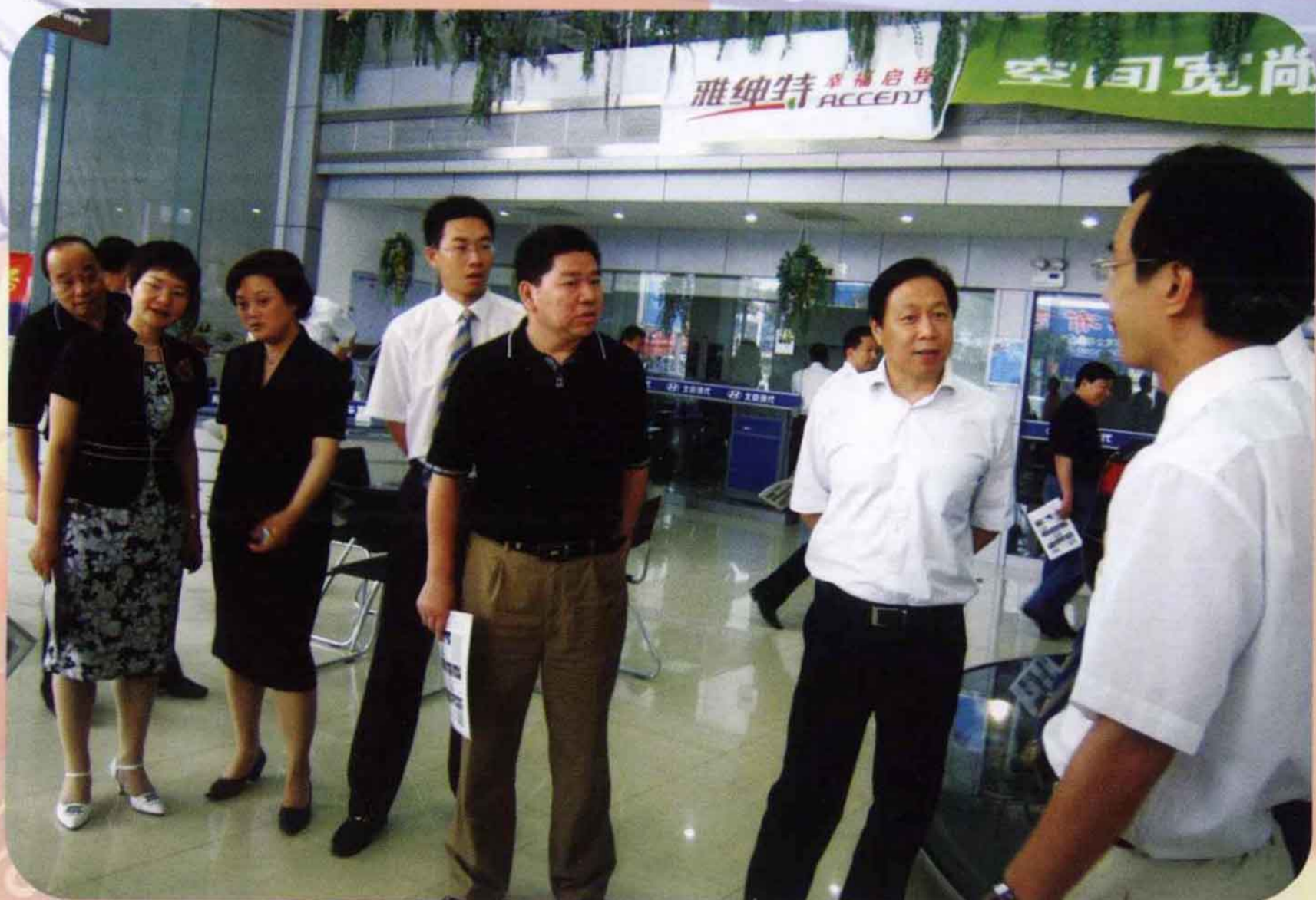
新密市市长赵新中（右2）率经济代表团参观中博汽车城