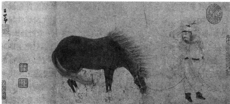
元 赵孟頫 《调良图》册页 纸本 水墨 纵22.7厘米 横49厘米 台北故宫博物院藏

“人生贵适意，要津何必据”，“吾生性坦率，与世无竞奔”，从赵孟頫这些诗文中表露了他有“无可无不可的通达”；“优游恬淡以求自适”与“乐而不淫，哀而不伤，怨而不怒”的儒家思想也不相忤。他对一切总是淡淡的，而且要求符合中和雅正的原则，这便是他参与“复古”的动力。元初，南北游仕以后，眼界开阔的赵孟頫首先切中了时弊。他说：“今人作画，但知用笔纤细，傅色浓丽；吾所画似简率，然识者知其近古”，前面是他对南宋画院遗风的批判，后面则是他“贵有古意”的自信。他为复古先验者们提出了强有力的论述，“书画同源一体”说这一文人画重要的理论建构，也许不是由赵孟頫首先提出，但经过他的提倡，成为风尚之先。在“石如飞白木如籀，写竹还与八法通”（赵孟頫题《秀石疏林图》跋语）的过程中，时弊得以扭转，而他本人的作品更是无可挑剔。他之人物、山水、花鸟、竹石、鞍马，无一不是“前元绝品”（明人张丑语），“清而不寒，高而不畏”（元人陆友语，陆友字友仁，号研北生），几乎画遍了古来所有成熟画种，且“风尚古俊，脱去凡迹”（元人虞集，1272～1348），“乃为一代之冠”（元人范梈，1270～1330）。他始终以“作画贵有古意”入手，勤于绘事，别人所画“精于此或劣于彼”，而“公悉造其微，穷其天趣，至得意处不减古人”（杨载《赵公行状》语，1271～1323）。作为赵氏族裔，陶宗仪在《辍耕录》卷七《赵魏公书画》中特为记载，大意是：世人称许公之画马只简单拿宋代李龙眠相比，熟悉的友朋则赞扬公之画马已经盖过了唐代曹霸、韩幹，陶九成说