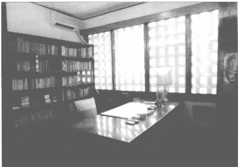
台北胡适故居的书房

古代的宗教大抵注重个人的拯救；古代的道德也大抵注重个人的修养。虽然也有自命普渡众生的宗教，虽然也有自命兼济天下的道德，然而终苦于无法下手，无力实行，只好仍旧回到个人的身心上用功夫，做那向内的修养。越向内做功夫，越看不见外面的现实世界；越在那不可捉摸的心性上玩把戏，越没有能力应付外面的实际问题。