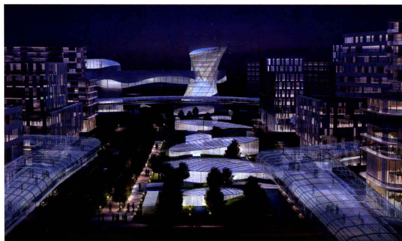
中轴线夜景效果图