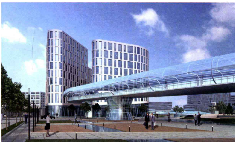
二层次步廊景观效果图

商务社区功能将具备社区自我管理、自我发展、良性运转的基本特征，具有良好的领域感，在社区内部将实现不同的功能混合，在互相联系的网络上设置生活所需的便利设施和服务设施。