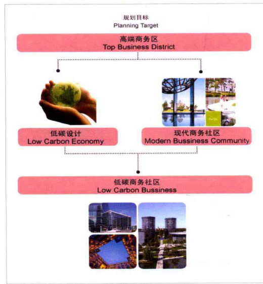
绿色建筑布局引导图