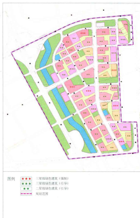
绿色建筑布局引导图