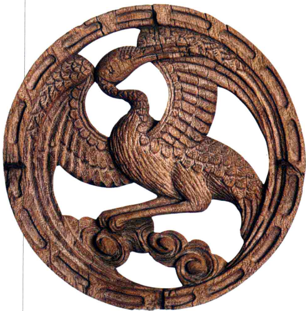
◎ 窗心 仙鹤图

我曾经有过这样的主张，但是，我二十多年来的“上山下乡”，亲眼见到，它们早就无家可归、无枝可依了，它们寄身的旧居早已片瓦不存，否则，它们也不可能被晓道买来。买来它们，实际上是抢救了它们。造公共博物馆，就是收容大批已经流浪着的木雕艺术品，免于散失或者被人深藏不露。难道还有更好的办法吗？它们的故乡，已经“现代化”了。