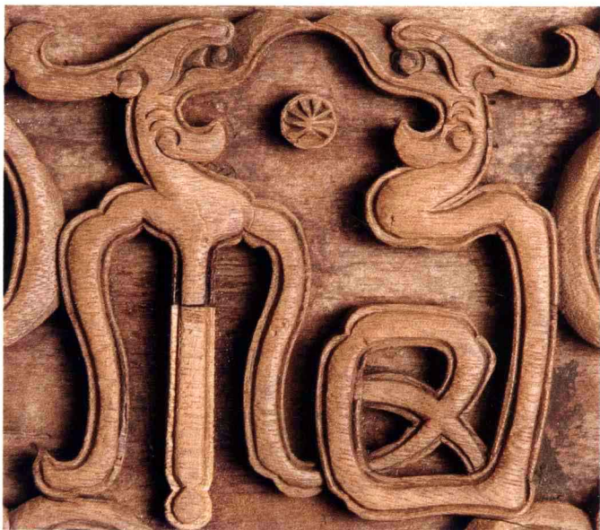
◎ 窗腰板局部 福字

“人总是按照美的规律进行创造的”，民间艺术品，还有更加丰富得多的民间日用品和劳动者生产工具，也都是很美很巧的。话说开去，即使那些并不以美观见长的工具、农具、车具、床具、餐具、