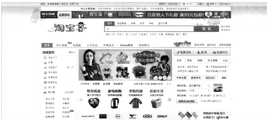
图 1-1 “淘宝网”主页浏览

首页左上方采用动画效果的“淘宝”两个字,能够直接体现淘宝网站的业务,左部和中部主要集中商品的分类菜单,右侧主要作为宣传广告版面使用,广告的色彩也和主题进行了很好的呼应。整个网站的文字颜色大部分使用低纯度的黑色,使浏览者感觉到柔和不生硬,整个网站看起来色调主次控制得和谐得当,如图 1-1 所示。