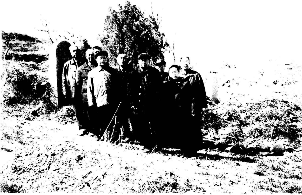
新安宗亲会成员在汝阳俊公十世孙魁公墓前 留影并对碑文进行考正