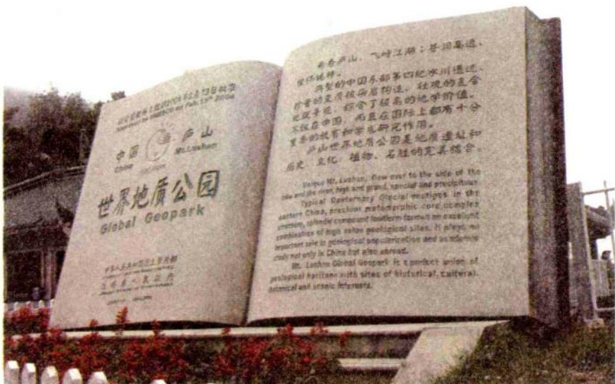
庐山——世界地质公园之一

“庐山”一名的文字记载最早见于《史记》，此前未见有文字记录，但山名的渊源存在多种说法，有民间传说，也有史料考究。