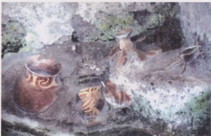
班清遗址中挖出的陶器碎片

挖掘工作愈发不可收拾，每天都有大量的文物被挖掘出来，到后来实在多得让工作人员无法一时清点出来，只能以吨来计算。到1975年，班清已挖出了各种文物共计18吨。其中除了大量的青铜器和金银装饰品之外，还有一些用象牙和骨头雕刻的人像，用玻璃和