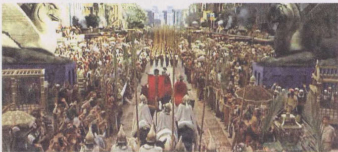
亚历山大大帝的军队凯旋而归

公元前326年夏天，在征服了波斯之后，亚历山大大帝直逼印度边界。强敌当前，国王色鲁斯纠集了一支包括200头战象的庞大军队，在希达斯派斯河（今印巴边界界河）摆下阵势。亚历山大大帝击溃了色鲁斯，自封为宇宙之王。为了纪念这次胜利，年轻的马其顿统帅下令铸造大批金银钱币，以便犒赏三军。在他死后，这笔财富神秘地消失在阿富汗的崇山峻岭中。