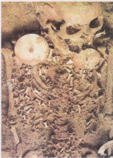
在班清遗址挖掘的墓穴中,一位女性佩戴着数不清的珍珠贝。