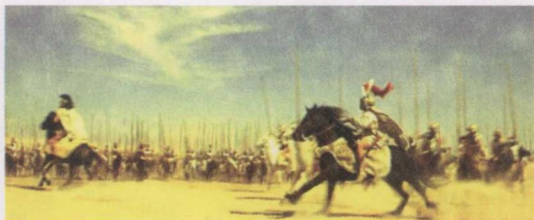
电影《亚历山大大帝》战场画面