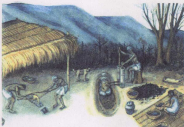
班清古人生活画面

陶器碎片送到了费城大学的考古研究中心。检测结果显示，这些陶器是在公元前4000年左右制造的！