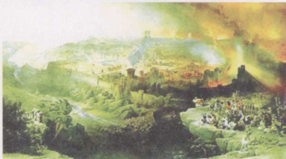
圣殿被毁后，犹太人颠沛流离的生活画面。