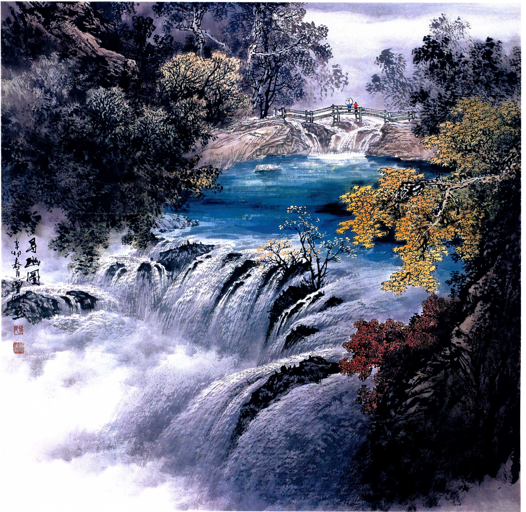
寻幽图 68 × 68cm