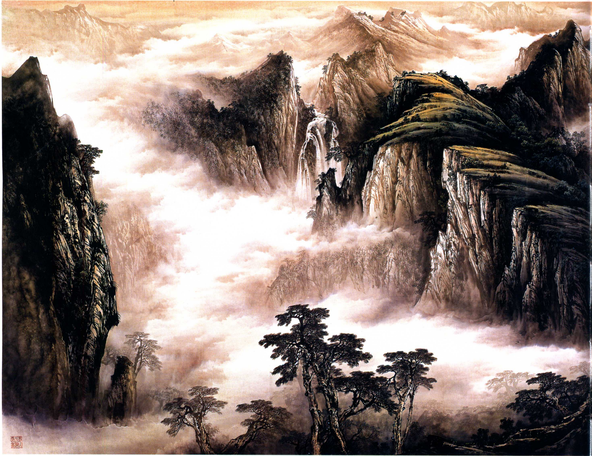
青山不老 绿水长存 495 × 195cm