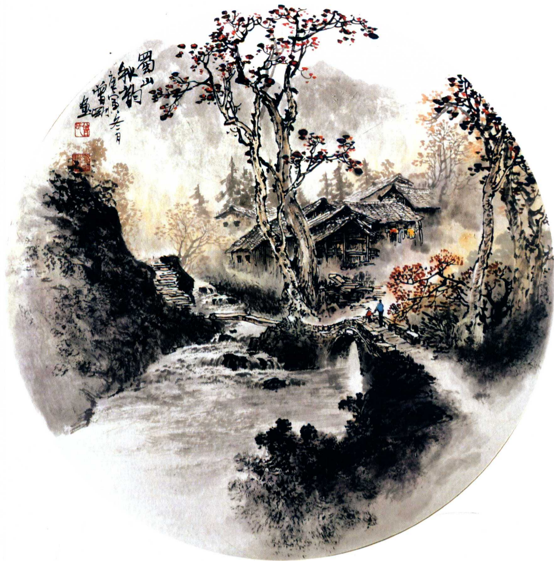
蜀山秋韵 45 × 45cm