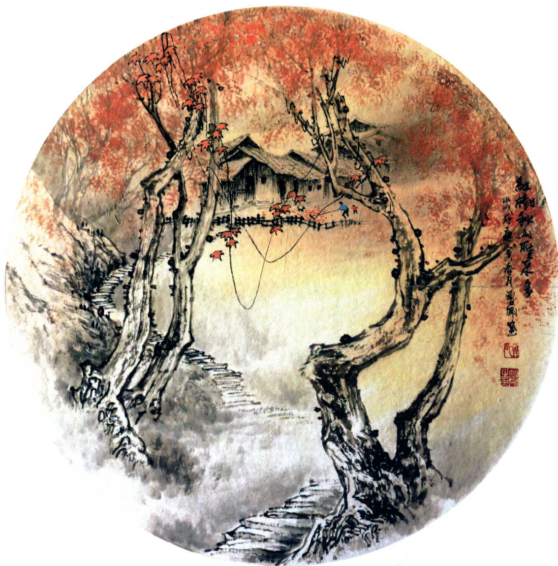
红树秋山雁来多 45 × 45cm