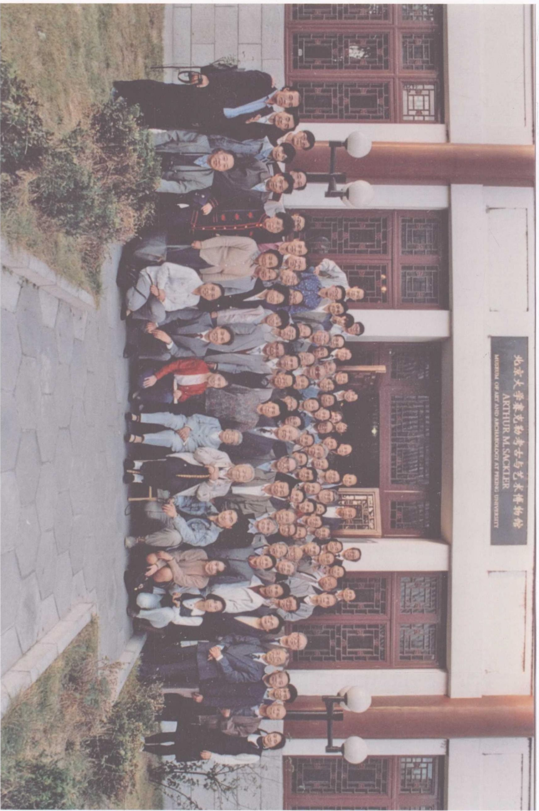
桃李满天下——1994年9月在北京大学考古系举办的“庆祝苏秉琦教授从事考古工作60年茶话会”上