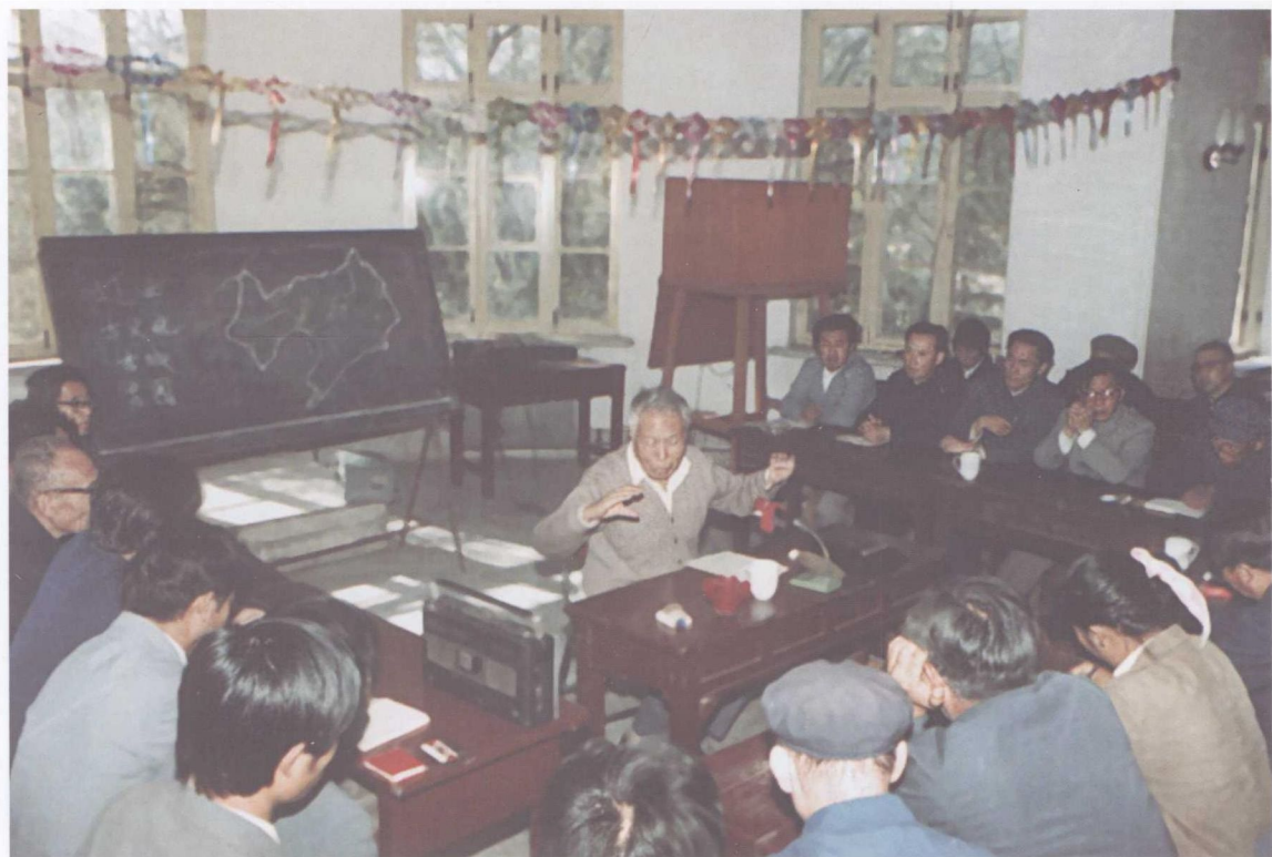
1985年10月13日在辽宁兴城作《古文化古城古国》的学术报告