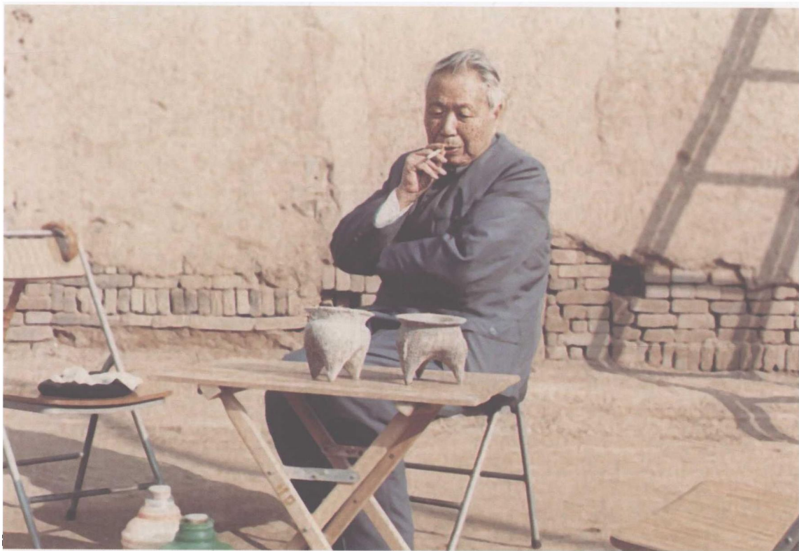
1985年11月在山西侯马考古工作站观摩陶器标本