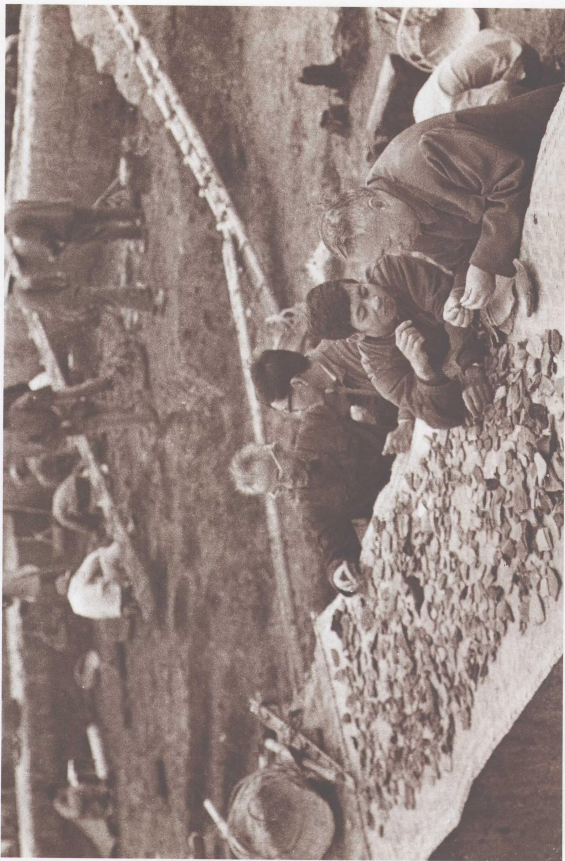
河姆渡遗址发掘现场