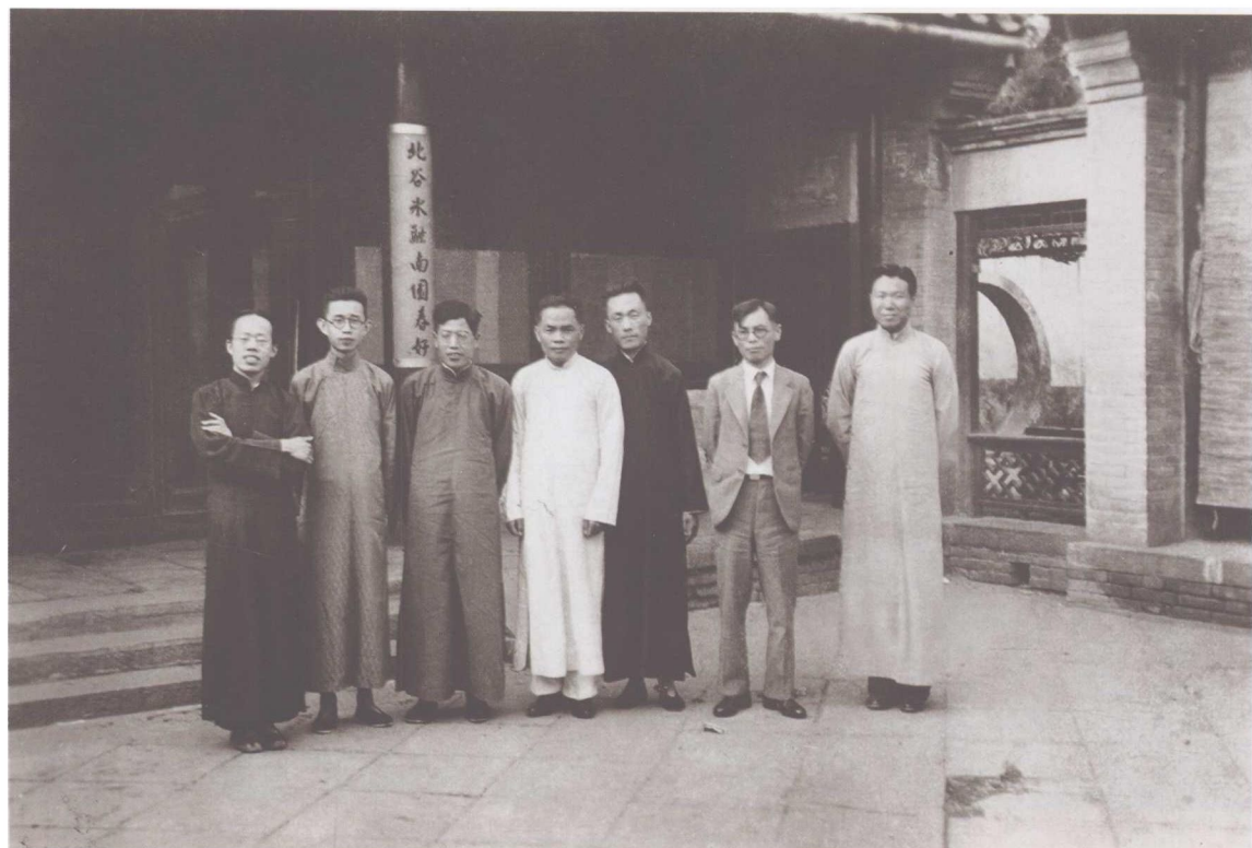
史学所同仁1935~1937年于中南海怀仁堂西四所