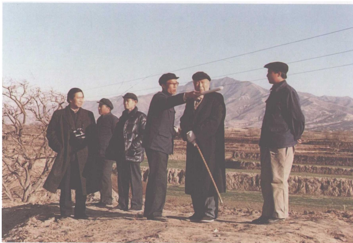
1985年11月考察山西陶寺遗址