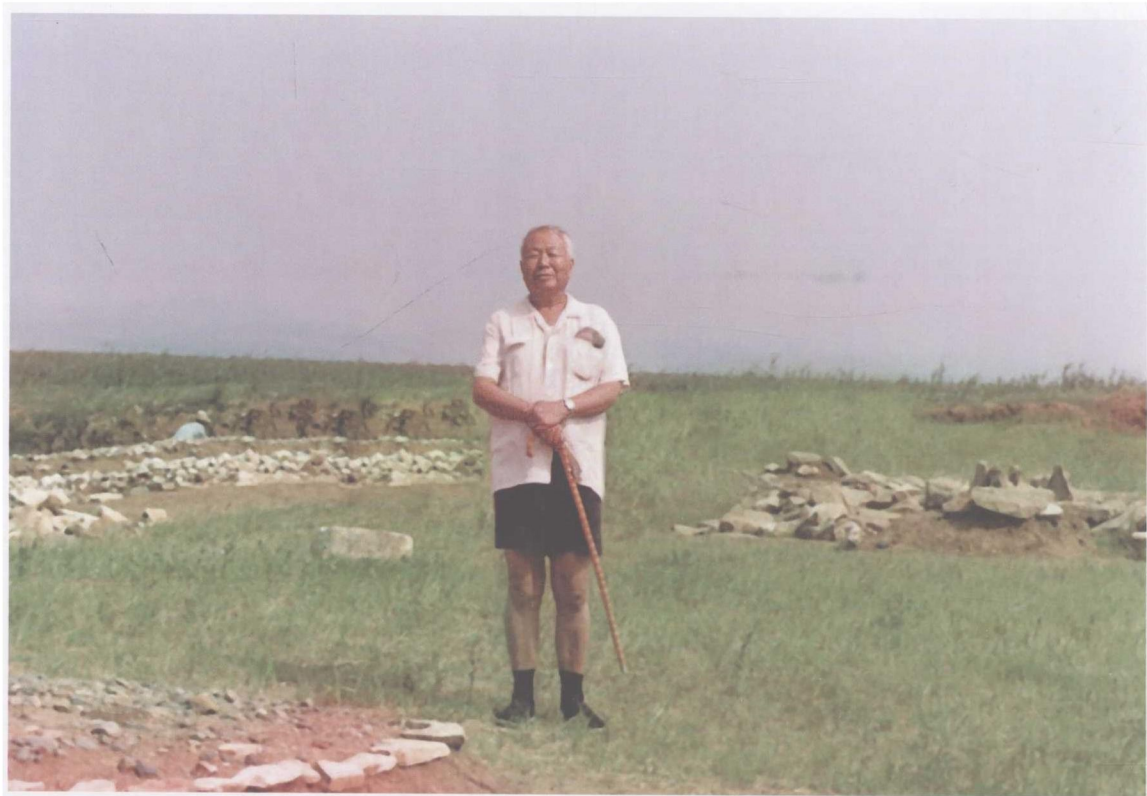
1983年7月考察辽宁喀左县东山嘴遗址