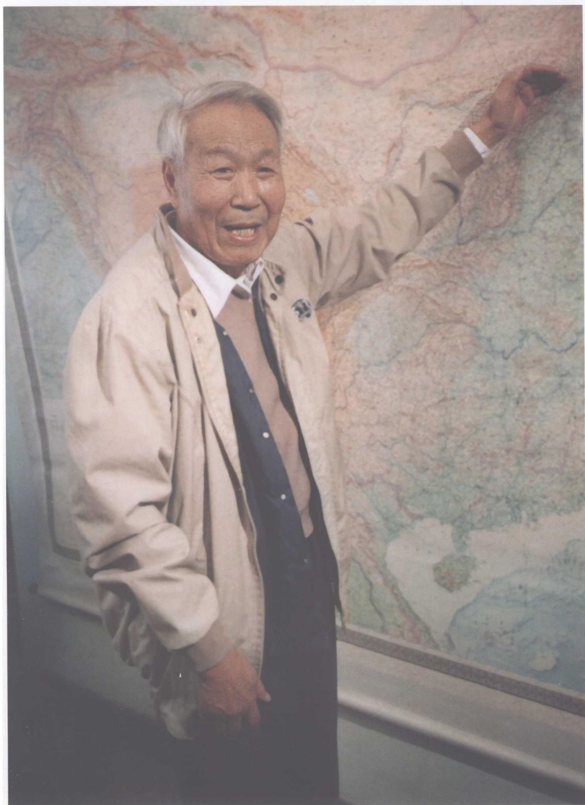
1990年冬在中国社会科学院考古研究所工作室