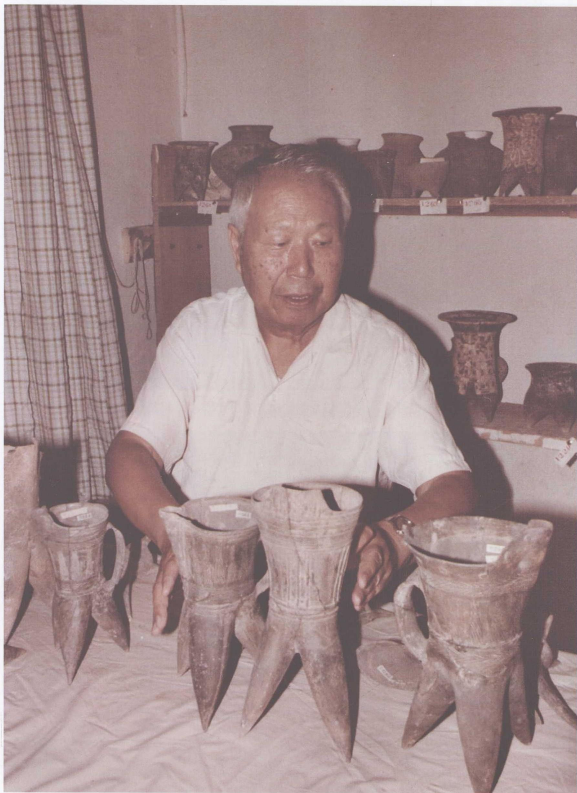
20世纪80年代初在河北省承德避暑山庄内蒙古工作队驻地观摩大甸子出土标本，以墓地分布为出发点指导资料整理和编写发掘报告