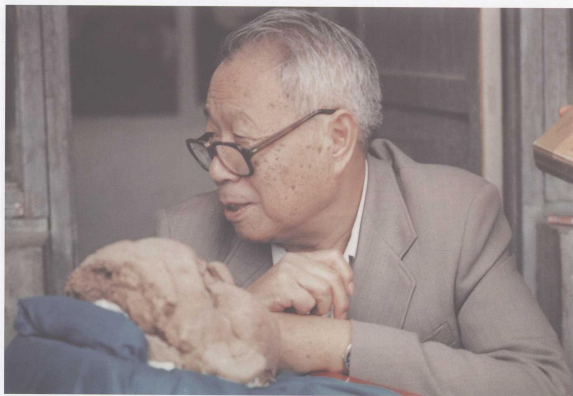
1987年秋在辽宁朝阳牛河梁考古工作站观摩女神头像