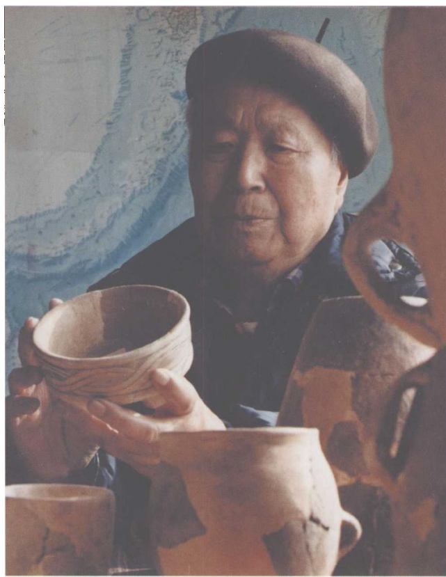
20世纪80年代在工作室