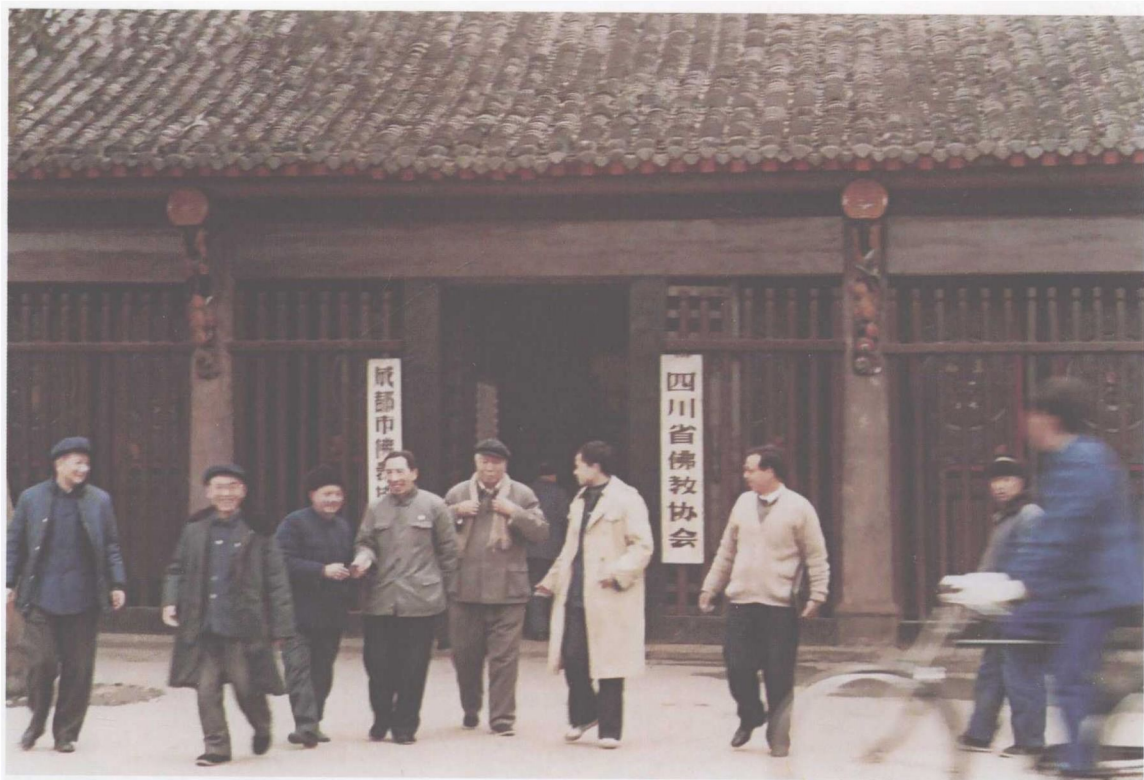
1984年3月成都会议（全国考古发掘与文物普查工作会议）期间与夏鼐先生参观三苏祠