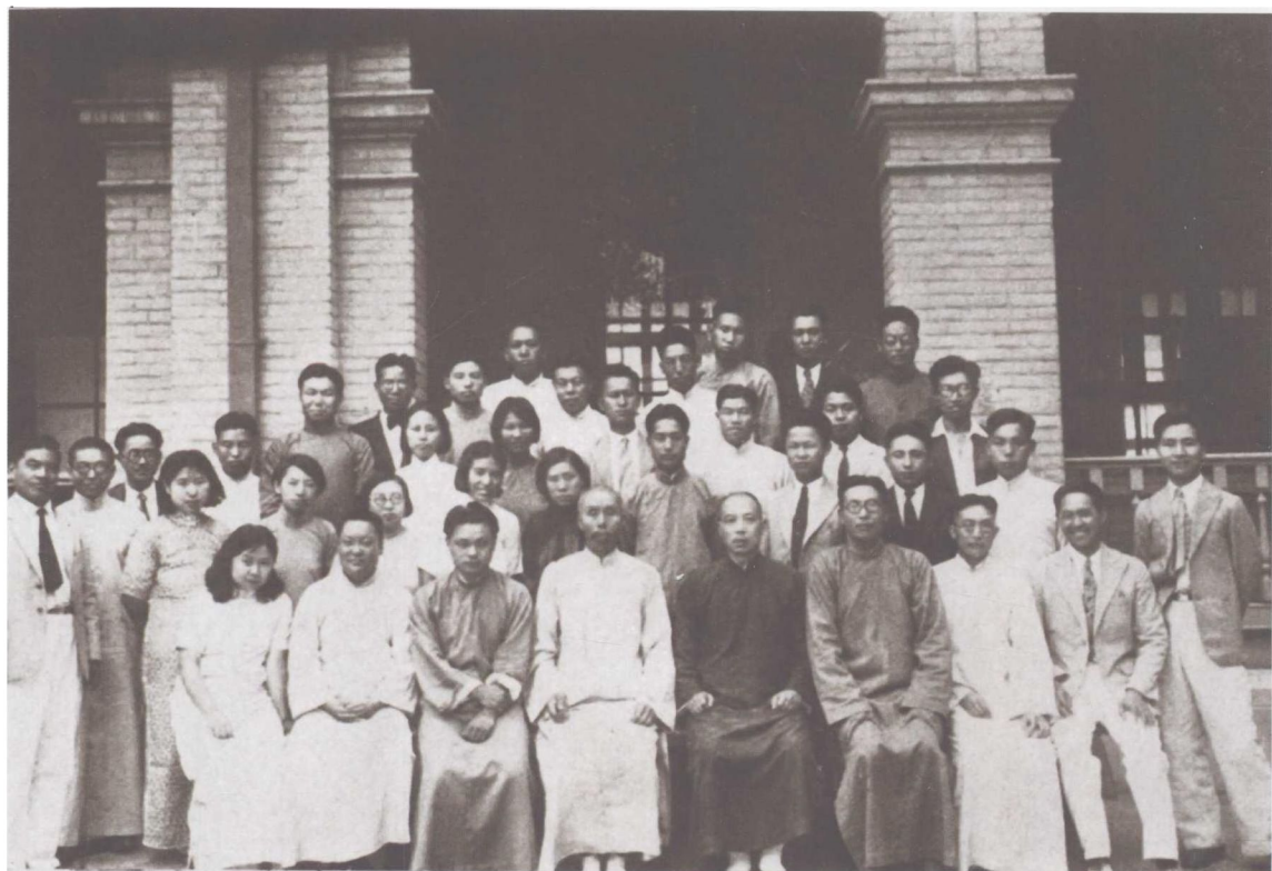
1934年北京师范大学历史系毕业生合影