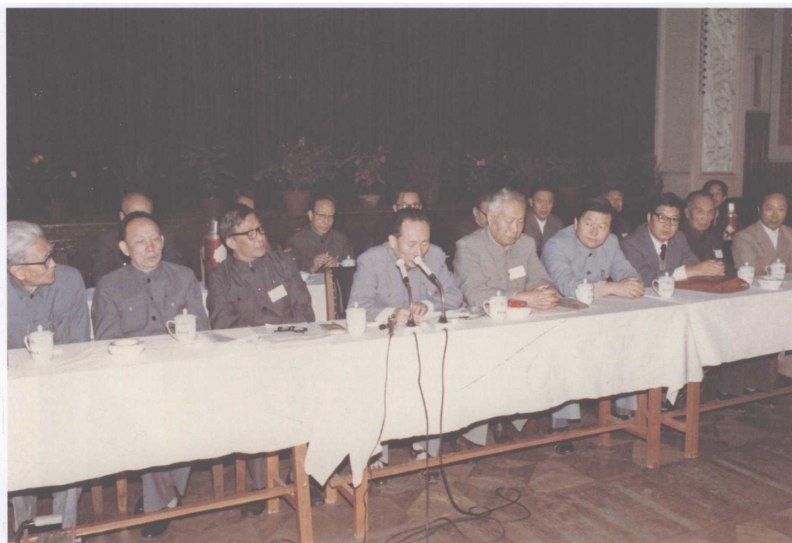
1986年9月在沈阳召开的中国考古学会第六次年会开幕式上