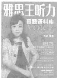
IELTS版的必会内 容：第3章、第4 章、第5章。

在这三章听写正确率达到95%以上之后，大家就可以继续练习听写其他章节了，这样雅思听力的分数会提高得更快。如果时间不够，那么就只好先好好完成这三章了。