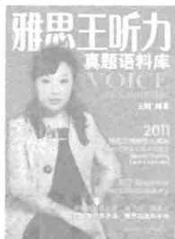
2011版的必会内 容：第6章、第7 章、第9章。