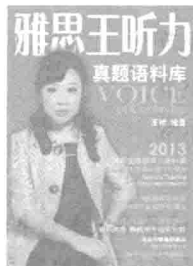
2013版的必会内 容：第3章、第4 章、第5章。