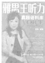
2012版的必会内 容：第3章、第4 章、第5章。