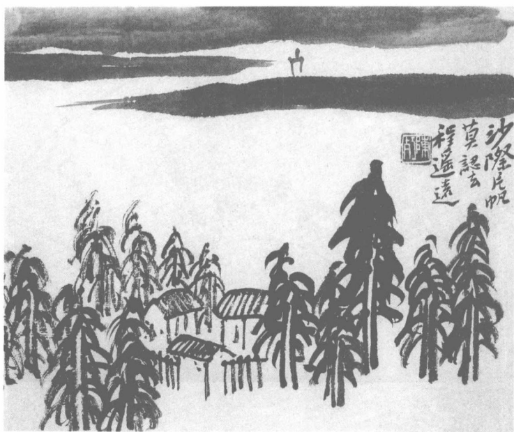
長兄師曾畫作「沙際片帆」