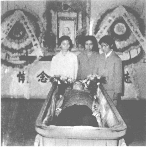
女兒流求、小彭、美延與父親告別 一九六九年十月十七日於廣州殯儀館告別儀式