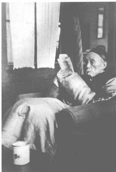
散原老人於北平姚家胡同三號 寓所內 一九三五年（六？）年