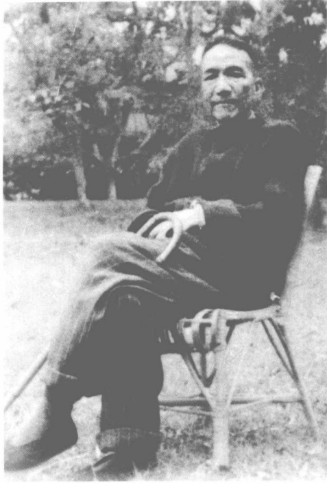
攝於廣州中山大學東南區一號草坪 一九六一年