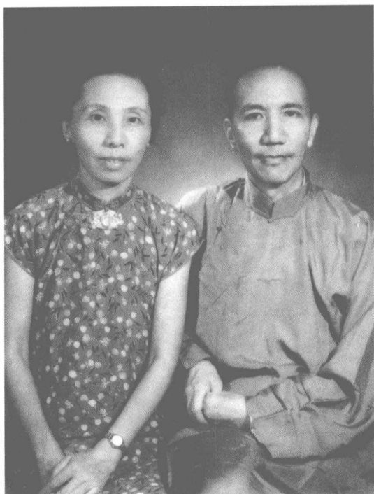
結婚廿三年紀念日合影 一九五一年八月