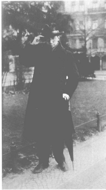
攝於德國柏林 一九二五年四月