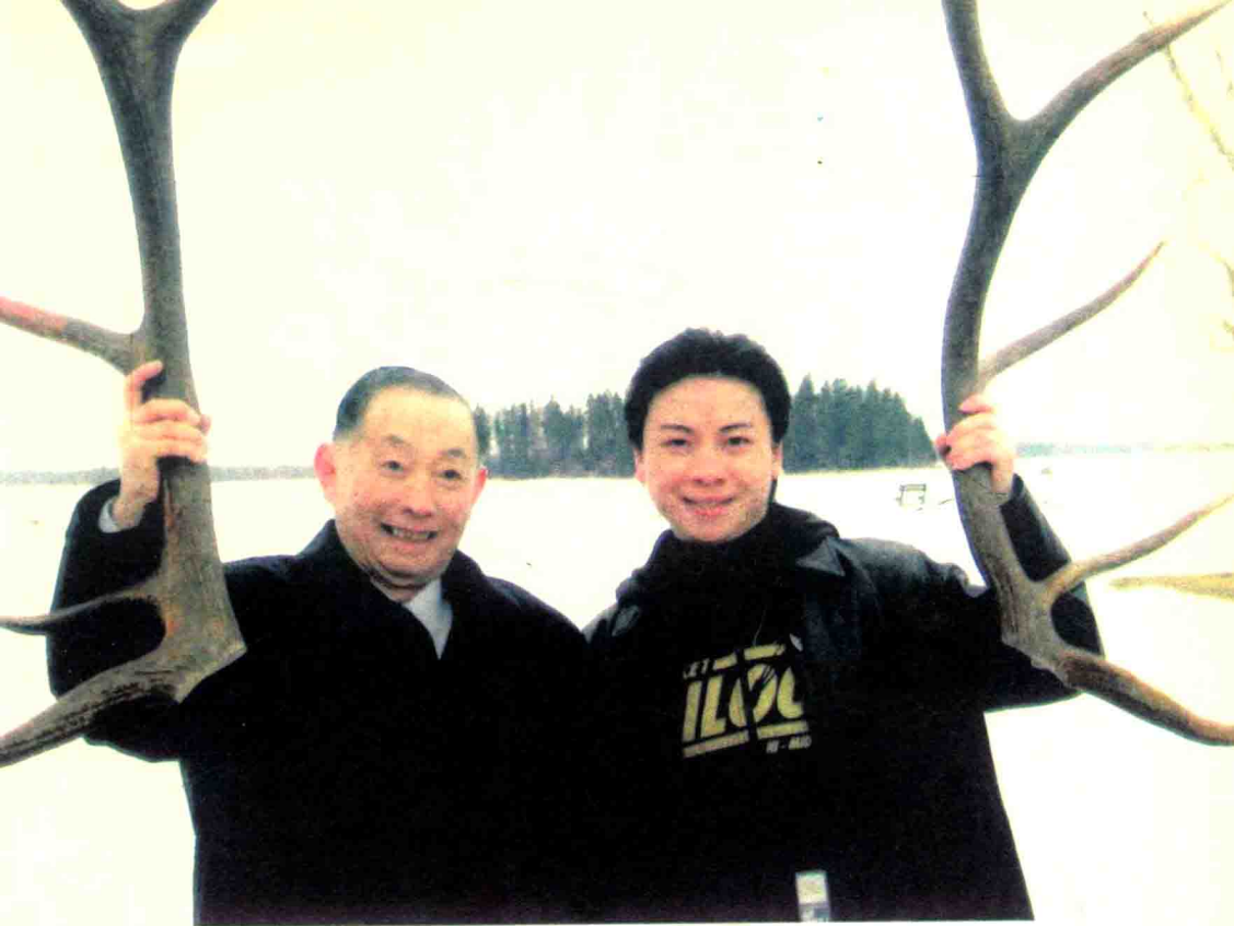
2007年，在加拿大国家森林公园师徒合影