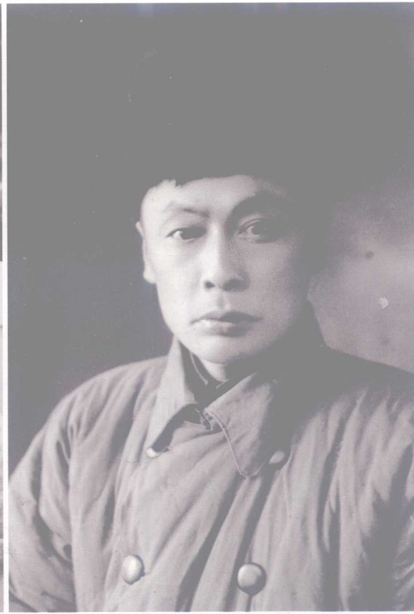
陈毅 时任新四军军长，后任华东野战军司令员兼政治委员，建国后任国务院副总理兼外交部长，1955年被授予元帅军衔。