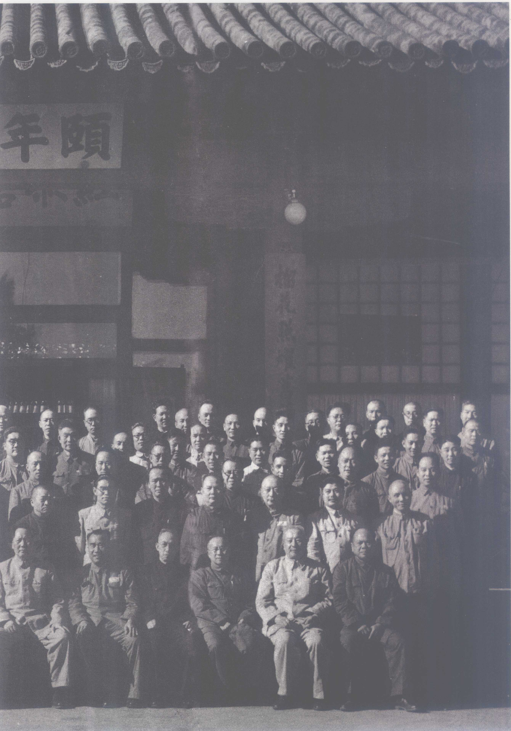
中国共产党第七届中央委员会第三次全体会议于1950年6月6日至9日在北京中南海举行，出席会议的中央委员和候补中央委员在中南海颐年堂合影。前排右三为张云逸。