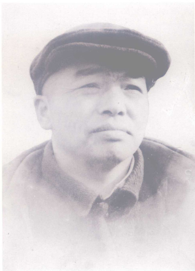
彭德怀 时任第十八集团军副总司令，建国后任中央军委副主席、国务院副总理兼国防部长，1955年被授予元帅军衔。