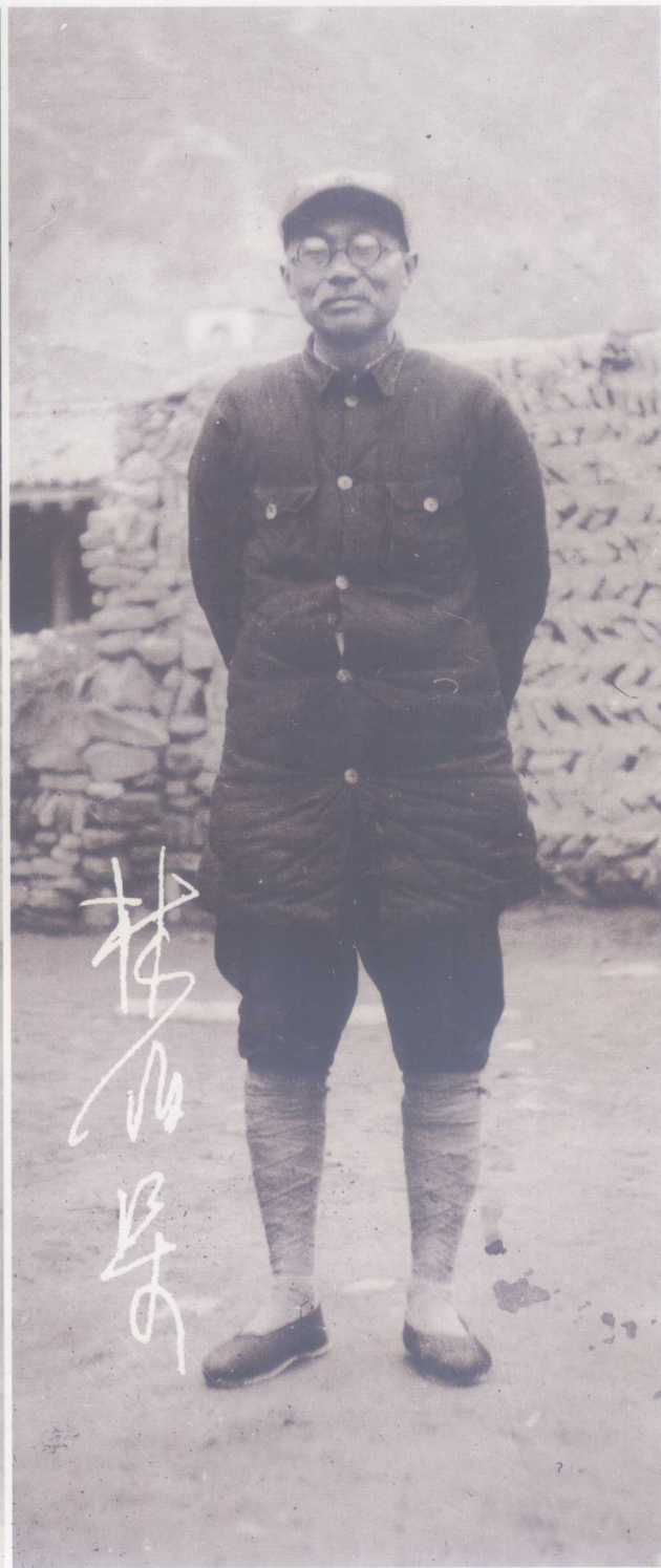
徐向前 时任国民革命军八路军第一纵队司令员，建国后任中央军委副主席、国务院副总理兼国防部长，1955年被授予元帅军衔。