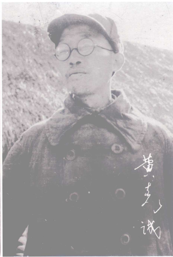
黄克诚 抗战时期任新四军第三师师长兼政治委员、苏北军区司令员兼政治委员，建国后任中国人民解放军总参谋长，1955年被授予大将军衔。