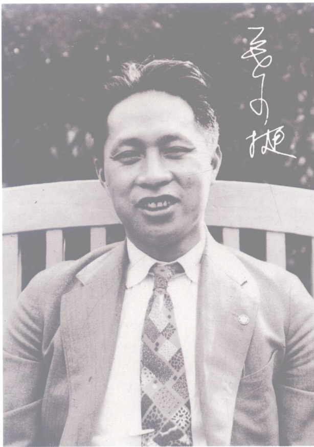
叶挺 时任新四军军长。