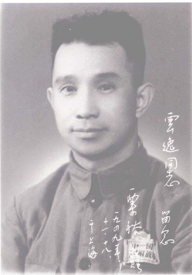
粟裕 抗战时期任新四军第一师师长兼政治委员，苏中、苏浙军区司令员兼政治委员。建国后任中国人民解放军总参谋长，1955年被授予大将军衔。