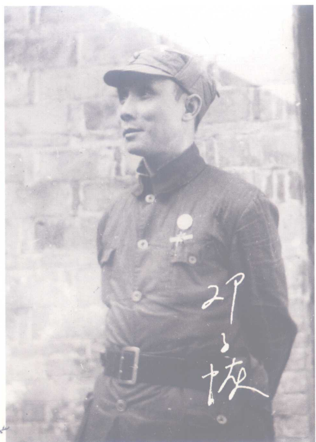
邓子恢 时任新四军政治部主任、第四师兼淮北军区政治委员，建国后任国务院副总理、全国政协副主席。