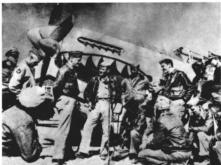
陈纳德与飞虎队在一起