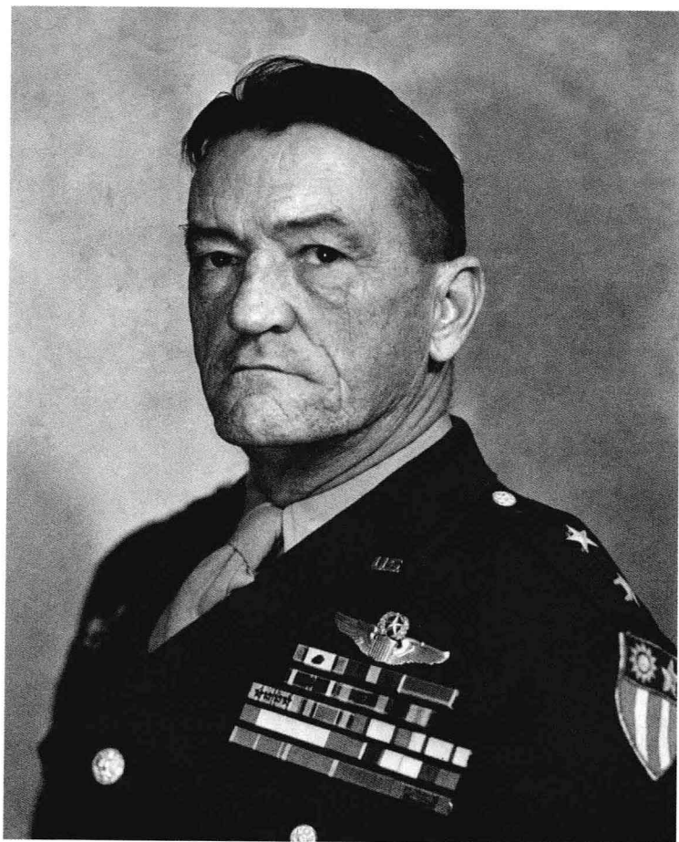
克莱尔·李·陈纳德 (Claire Lee Chennault)