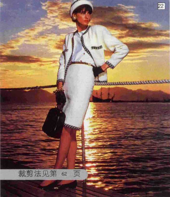
裁剪法见第 62 页