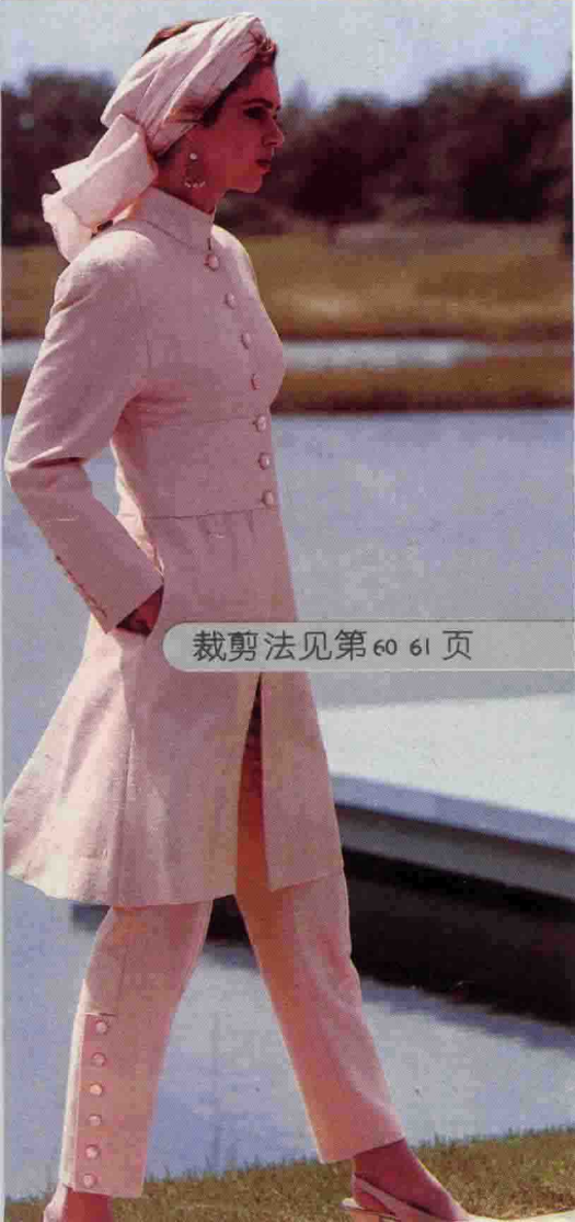
裁剪法见第 60 61 页