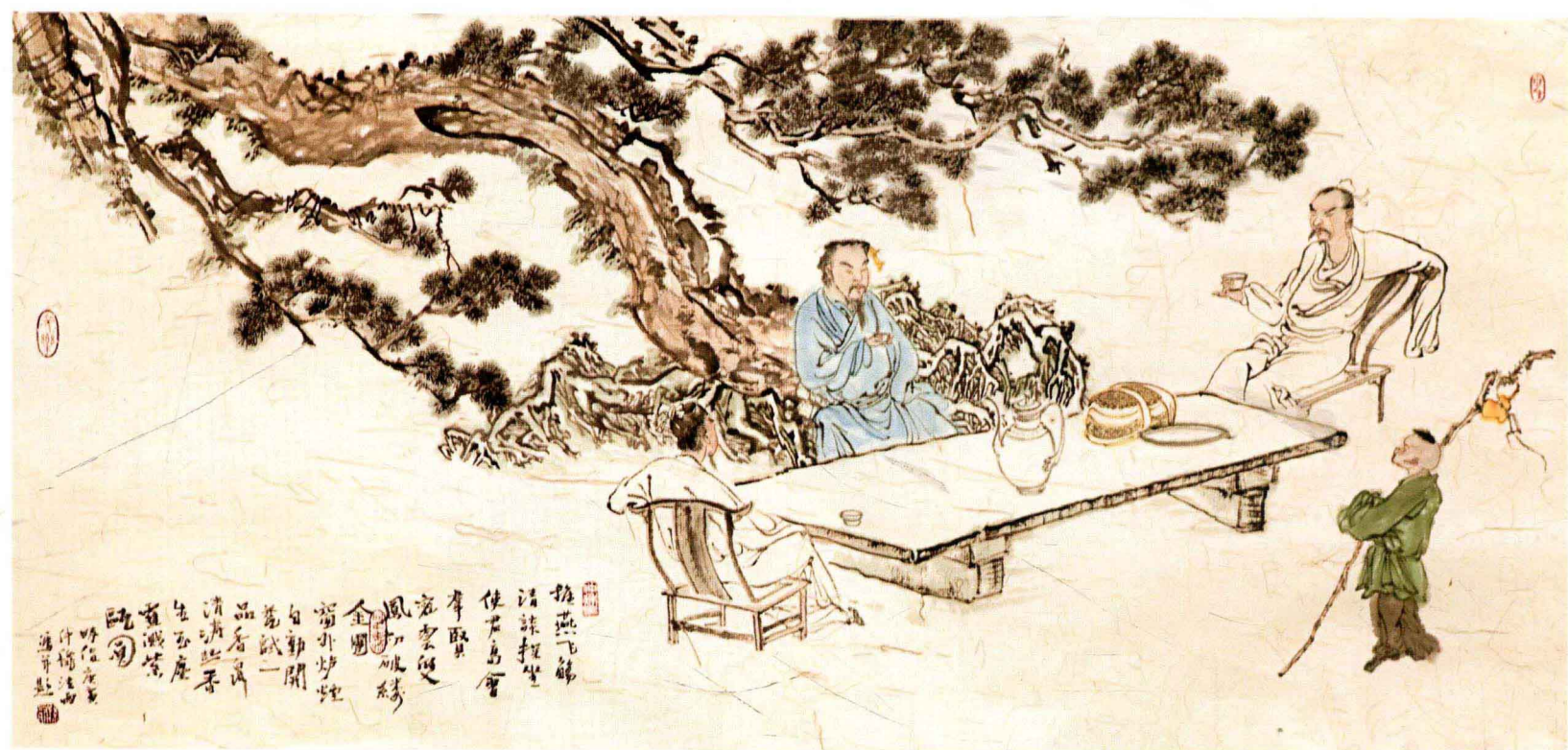
《品茗图》38cm × 110cm 纸本设色