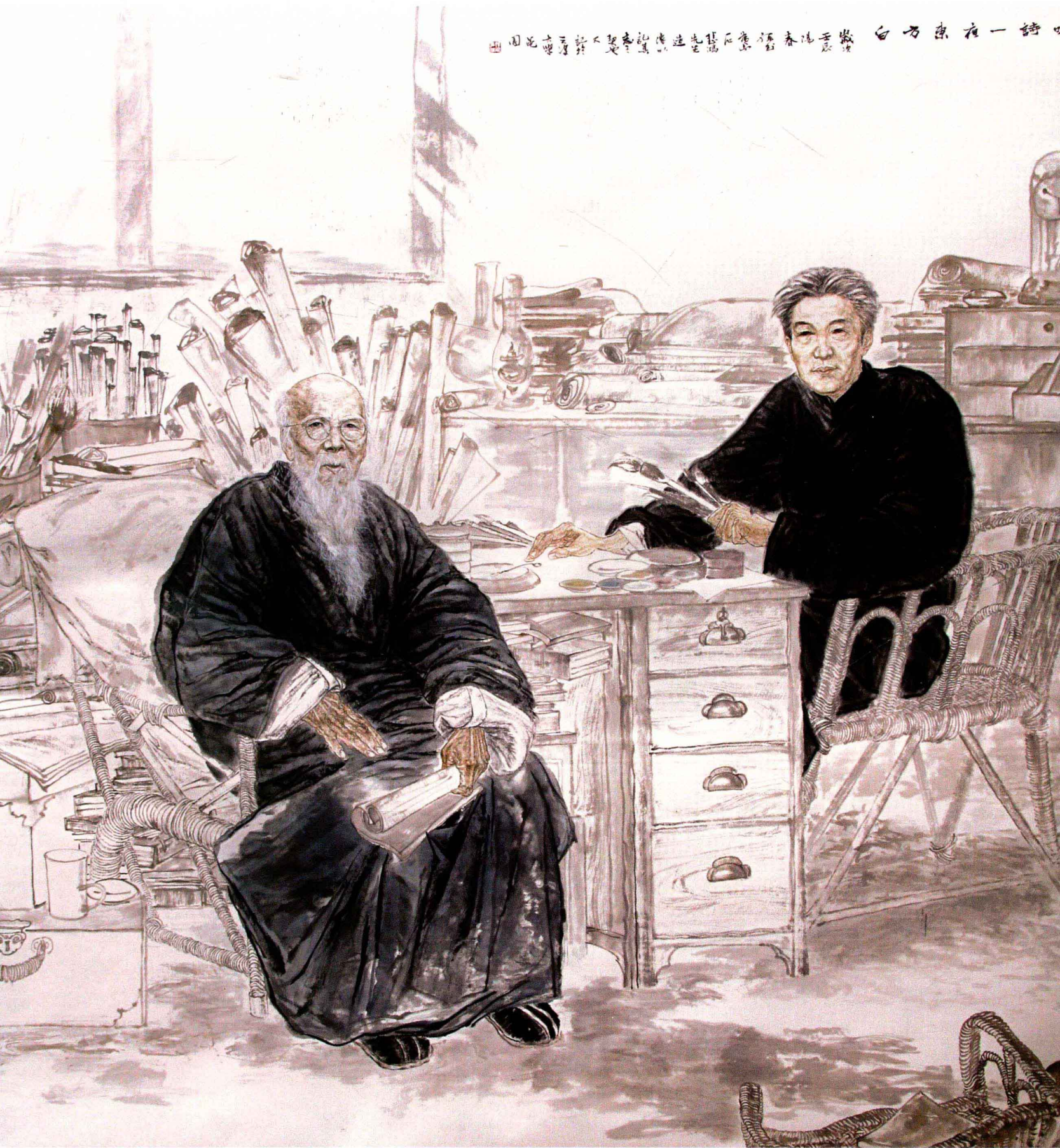
《吟詩一夜東方白——為白石、悲鴻先生造像》185cm x 195cm 紙本設色

吟詩一夜東方白——為白石、悲鴻先生造像 畫 陽 春 不 忘 先 生 造 像 記 其 不 下 三 萬 卷 書 畫 圖