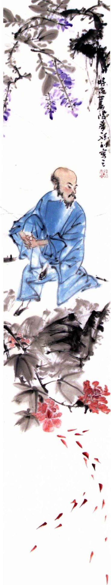
《人物四条屏》133cm×23cm 纸本设色