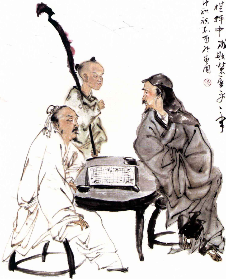
《淨堂手談圖》133cm x 68cm 紙本設色

淨堂手談云於窮思心盡藏襟中成敗策摩子一事 可知紅塵本相同 時後王后仲如流亦可於苗園