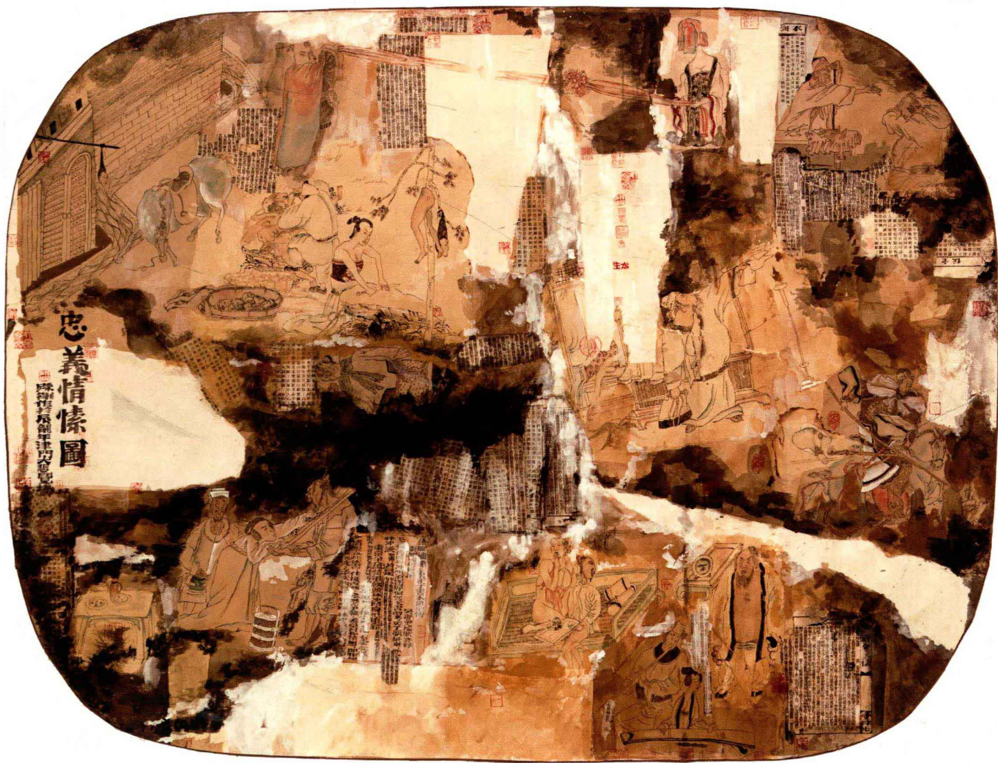
《忠义情愫图》 118cm × 156cm 综合材料