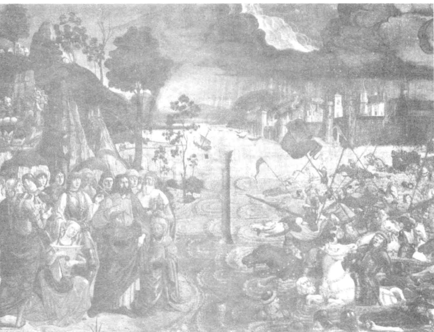
《摩西的生活之渡过红海》 科西摩·罗塞利作 “他们因为不愿被奴役，所以选择了流浪的生活”，摩西带领族人在西奈山下祈求耶和華為他们指路。

事实上，许多宗教由于受到多神教的桎梏，并不能形成一个明晰的意象。相应地，人类的信仰也不能简单地归结为是严肃情感的产物，尽管严肃的态度是宗教和道德本身的主要成分。例如印度的婆罗门教，几乎全靠一种极强的保守性才得以延续至今；佛教西传以失败而告终；德鲁伊特教始终都只是本土的国教，也并没有成为全世界的信仰；希腊的俄尔普斯主义及其宗教改革尝试，也并没有帮