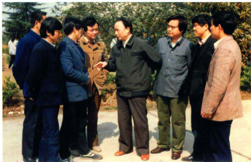
1987年给研究生讲授政治学，课间休息时研讨问题。