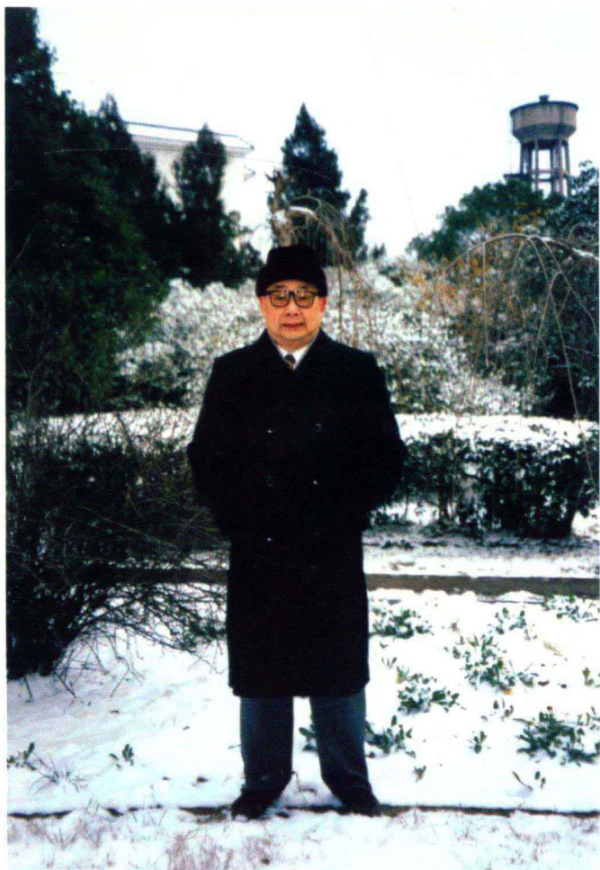
2004年冬摄于华中师范大学桂子山