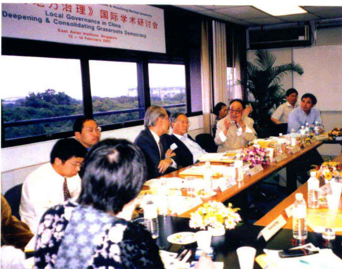
2005 年在新加坡举办的村级地方治理国际学术研讨会上讲话。