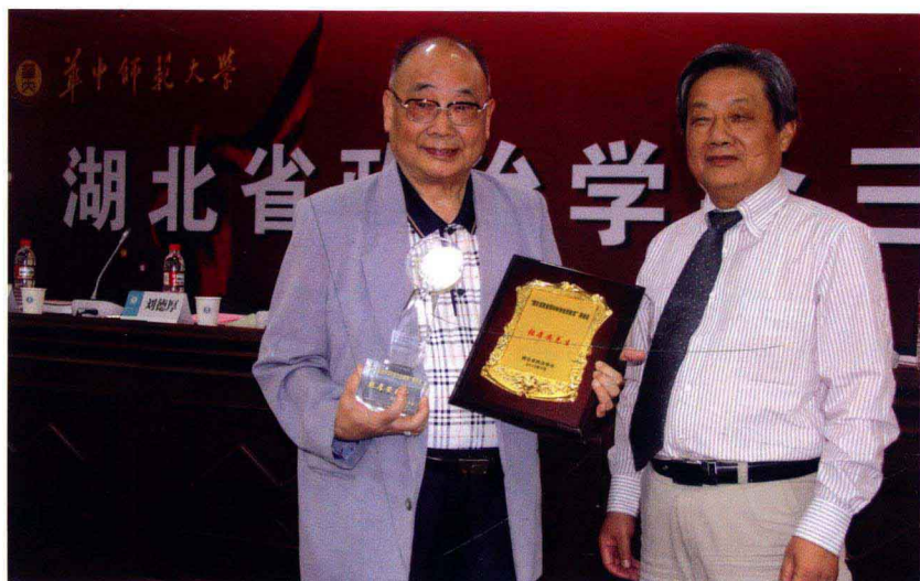
荣获湖北省政治学会颁发的“湖北省政治学30年突出贡献奖”