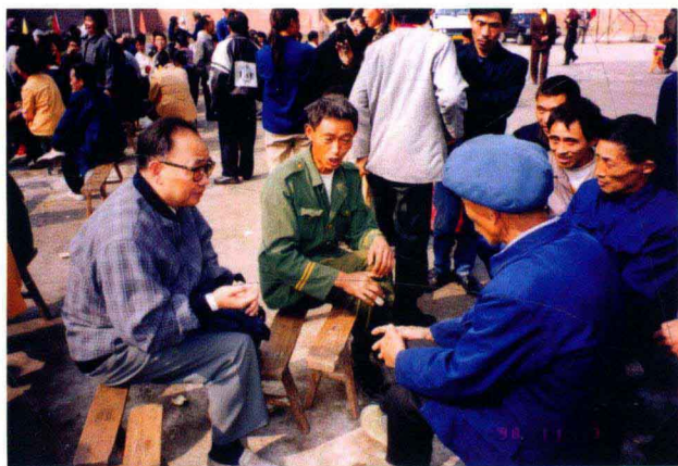
1997年考察达川市复兴镇九龙村第四届村委会换届选举,在考察中与村民交谈