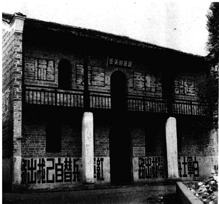
湘贛省军区旧址 (江西省永新县城原禾川中学内)