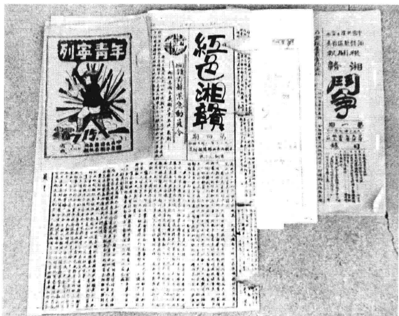
湘赣苏区出版的部分报刊