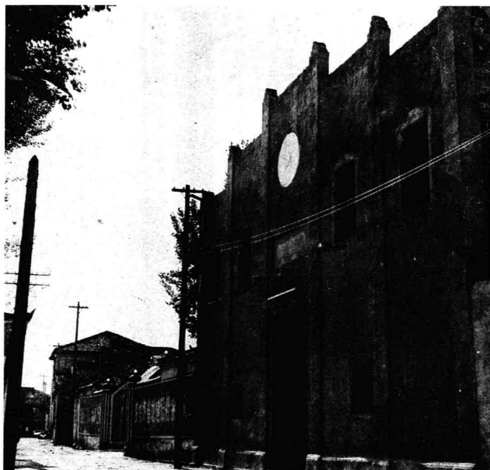
湘贛省苏维埃政府旧址 (江西省永新县城万寿宫)