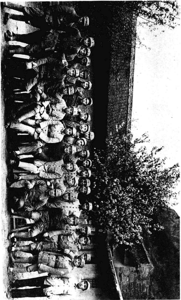
王首道、张启龙、谭余保、胡耀邦、王思茂、周仁杰、段苏权、刘俊秀、易湘苏、李立等部分湘赣苏区老战士1939年5月在延安合影。