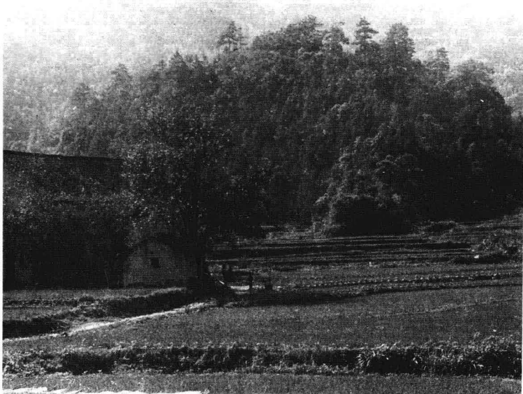
棋盘山会议旧址(1935年7月)