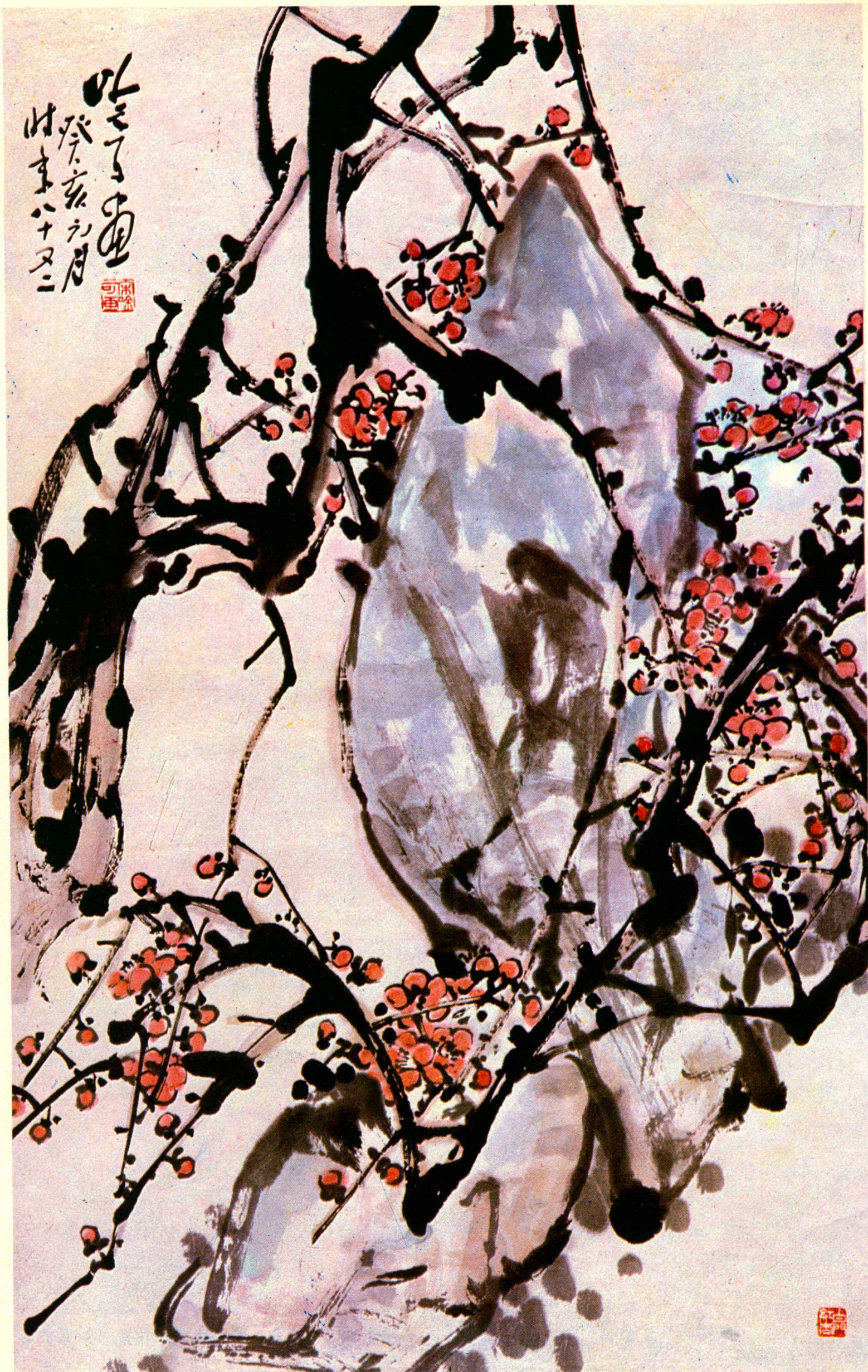
1 梅 (国画)