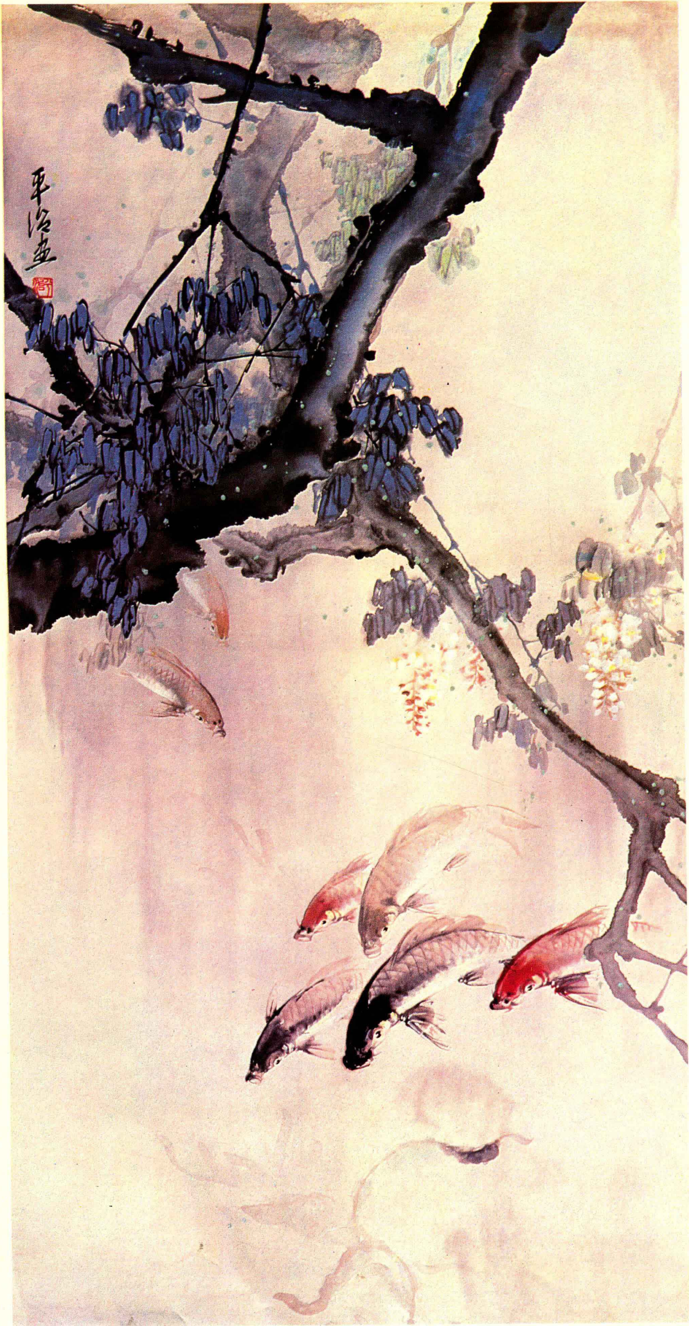
8 槐花鲤鱼 (国画) 平治