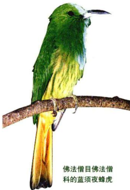
佛法僧目佛法僧科的蓝须夜蜂虎