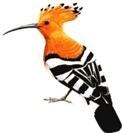
佛法僧目戴胜科的戴胜

佛法僧目是鸟纲中的一目，这可是一个大家庭，包括翠鸟科、短尾鸫科、翠鸫科、鹡鸰科、蜂虎科、佛法僧科、戴胜科、林戴胜科和犀鸟科等9科49属200多种鸟类，大部