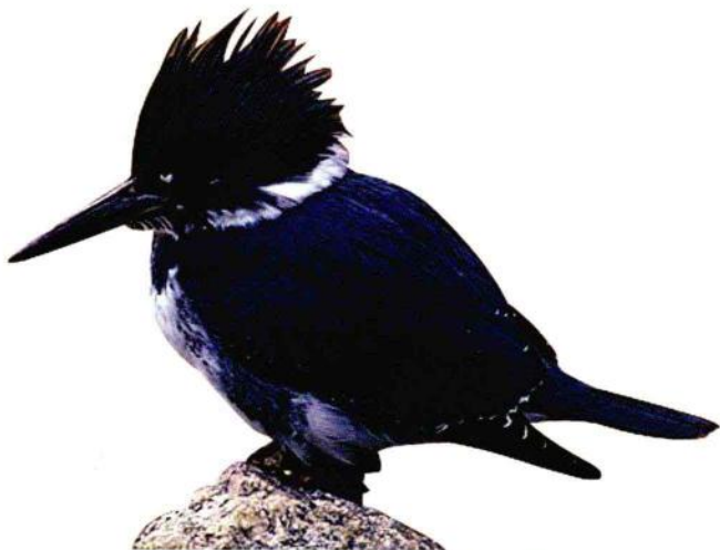
许多翠鸟头戴美丽的羽冠，非常可爱