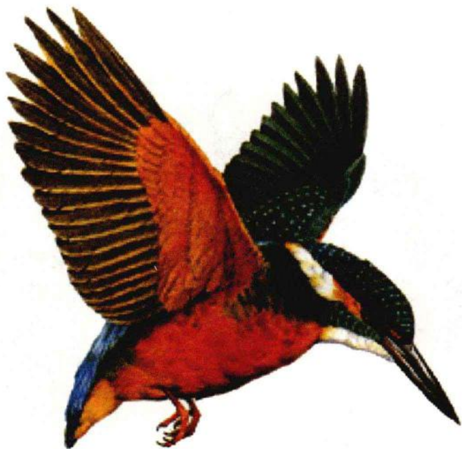
翠鸟的飞行速度很快，长长的嘴巴是捕鱼的主要工具