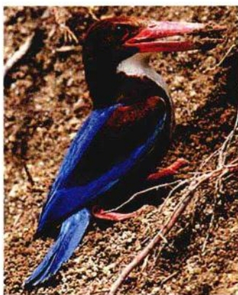
雌雄翠鸟交配以后，雄翠鸟会主动承担起建造家园的任务

翠鸟完成交配后，夫妇俩开始建设自己的巢穴。它们手脚并用，在河畔或湖边挖掘一个0.5~1米深的洞穴，末端加宽成一孵卵室。尽管它们不收集营巢的材料，洞穴却铺