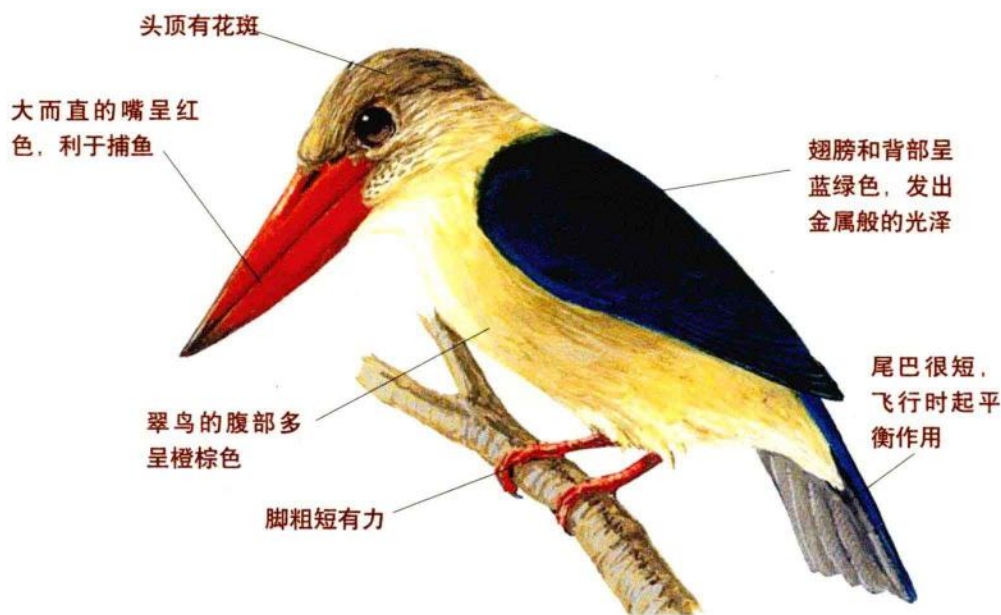
鹳嘴翡翠是翠鸟的一种，外表美丽

有点像啄木鸟，头大嘴大，长长的大嘴巴坚硬刚直，末端尖锐，棱角分明。身体上部的羽毛为翠蓝色且具有金属般光泽，下部羽毛为橙棕色。胸下栗棕色，翅翼黑褐色。脚比较短小，前三趾中二趾相并，一趾稍短，后趾强而有力，脚上的皮肤呈珊瑚般的红色，格外美丽。尾巴很短，但飞起来非常灵活。翠鸟因其外表异常美丽，自古以来就被人们当做观赏鸟来饲养。