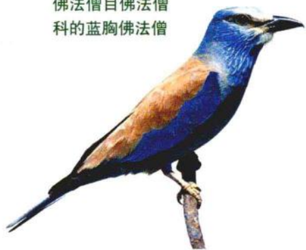
佛法僧目佛法僧 科的蓝胸佛法僧

佛法僧目的鸟类中，最小的也是翠鸟。翠鸟的嘴巴很大，有的笔直，也有的稍弯曲，还有的头顶突起。翠鸟的脚短小，三趾在前，一趾在后。翠鸟最大的特点是形态矫健优美，羽毛的色彩艳丽，有的具有金属般的光泽，翅膀大而宽广，尾部短小有力。