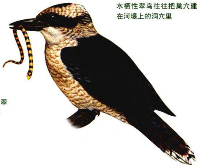
笑翠鸟是林栖性翠鸟，能够捕捉毒蛇