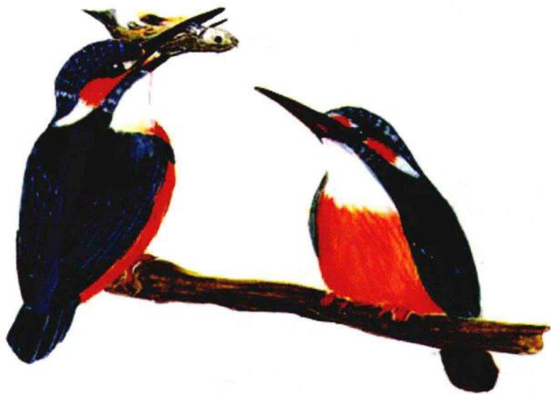
雄翠鸟在求偶时，会殷勤地把自己捕到的鱼献给雌翠鸟，以获得雌翠鸟的芳心