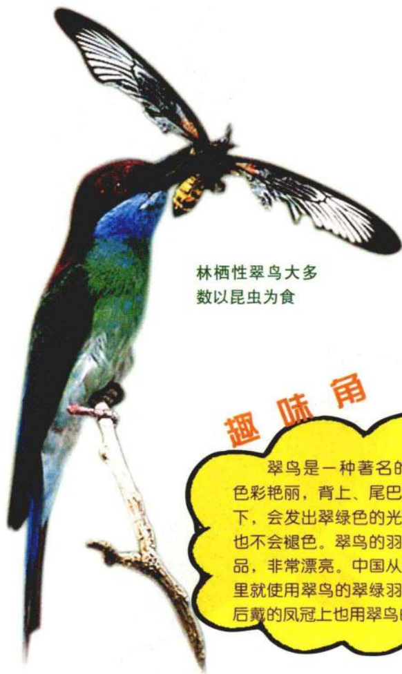
林栖性翠鸟大多数以昆虫为食