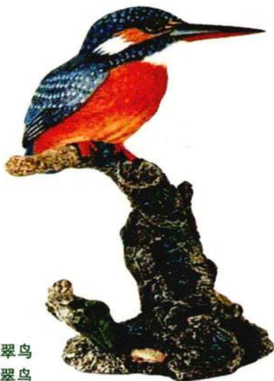
佛法僧目翠鸟科的普通翠鸟