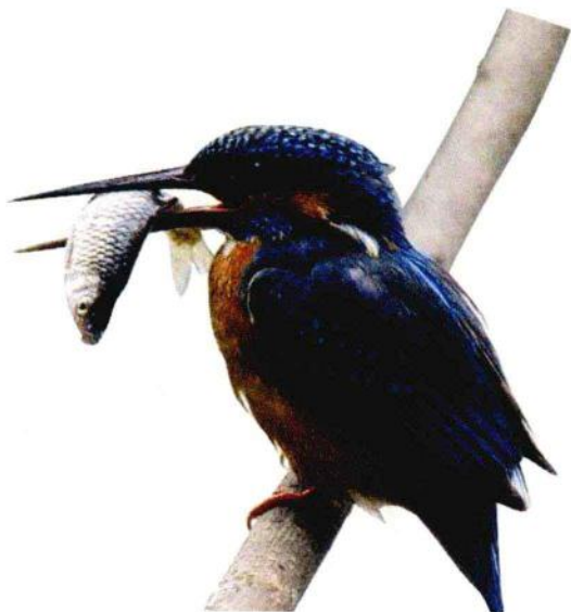
普通翠鸟是水栖性翠鸟的代表，是捕鱼高手