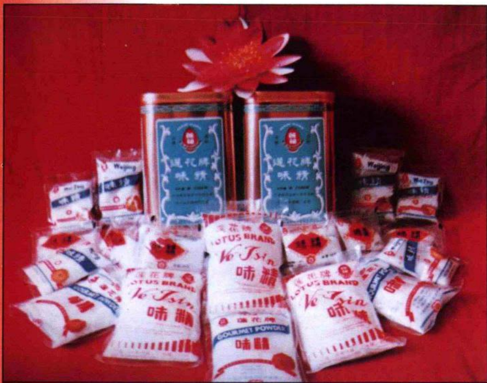
多次获国内、国际金奖的莲花牌味精系列

周口味精厂现有职工8000人，占地46万平方米，拥有固定资产2.5亿元。下属两个总公司，即供应总公司和销售总公司。年产10万吨的三个玉米淀粉分厂，一个年产2万吨的液氨分厂，一个日发电28万度，年蒸汽3400吨的热电联供分厂，一个年产600万只的包装箱分厂，一个年产5万吨的饲料分厂，一个年产1000吨的蛋白分厂，一个装璜彩印分厂，22个后勤处室，下属25个生产车间，实现在生产上的配套成龙。