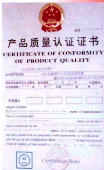
1993年4月首家荣获国家质量方圆标志认证证书