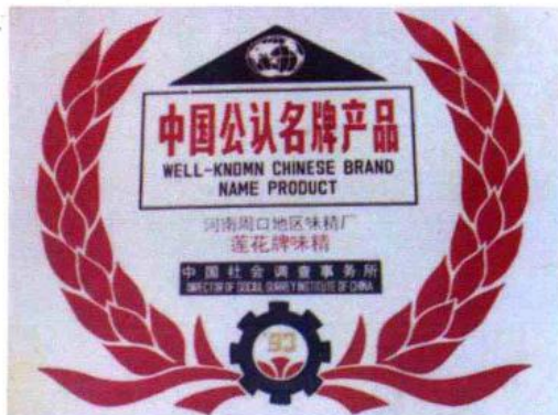
中国公证名牌产品