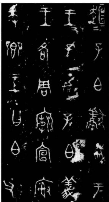
图2-5 《虢季子白盘》局部