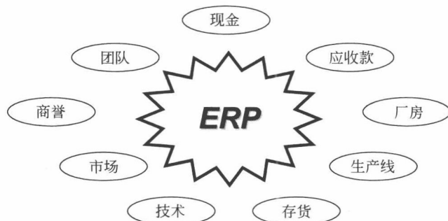
图 1-1 企业资源

顾名思义,ERP 就是对企业的所有资源进行计划、控制和管理的一种手段。ERP 的核心是计划,对象是企业资源。企业资源是指支持企业业务运作和战略运作的各项要素,也就是“人”、“财”、“物”和“信息”,具体来说,包括厂房、设备、物料、资金、人员,还包括企业上游的供应商和下游的客户等,如图 1-1 所示。