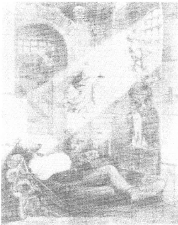
施温德作《囚犯的梦》