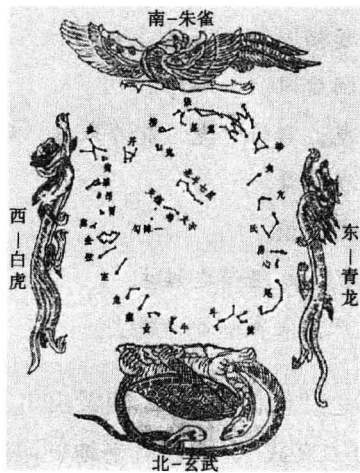
二十八宿四象图 (下北)