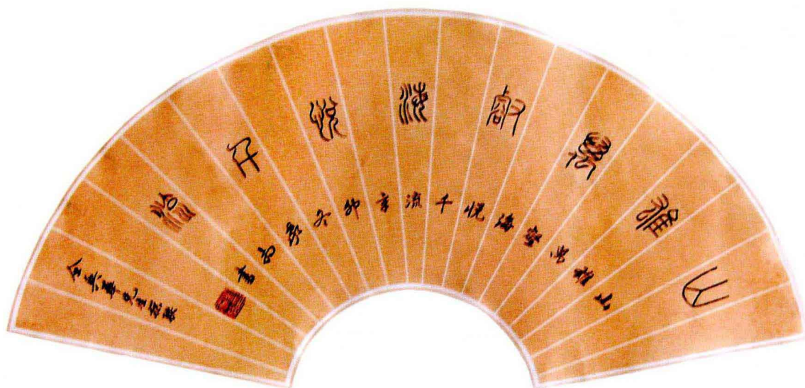
全兴华撰联 山雄·海悦 小篆扇面