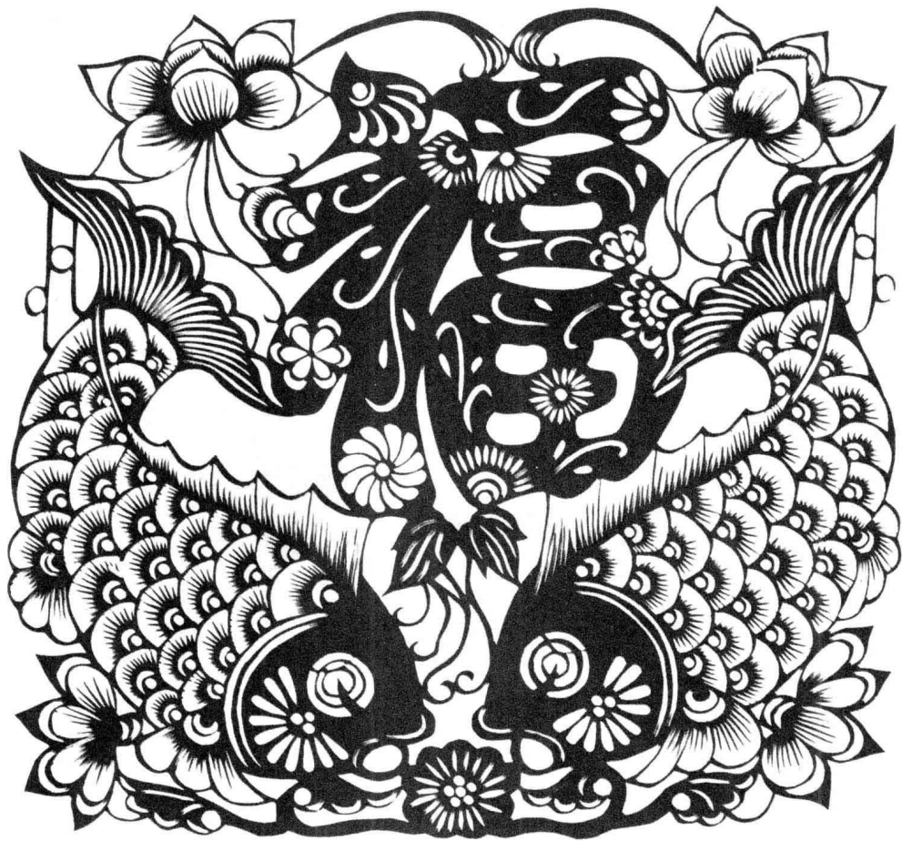
连年有余富：莲、连同音，鱼、余同音，日子富裕的意思。