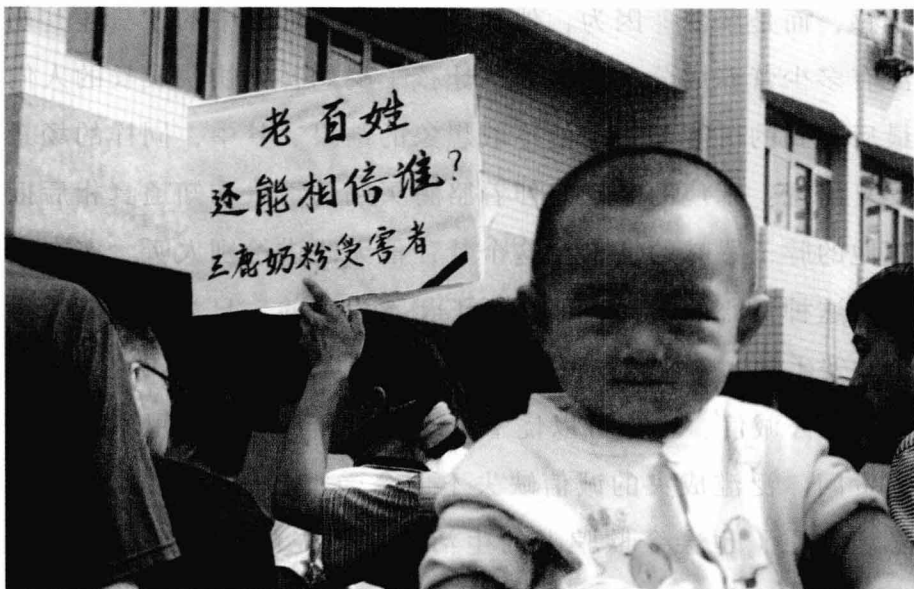
“毒奶粉”伤害的不仅是孩子们的身体，还有老百姓对于社会的信任。“老百姓还能相信谁？”这近似绝望的呼喊，需要我们每个人的回应。

另一方面，那些作假、欺骗的人，是否会因为得到了大把大把的金钱而过上了无忧无虑的生活了呢？