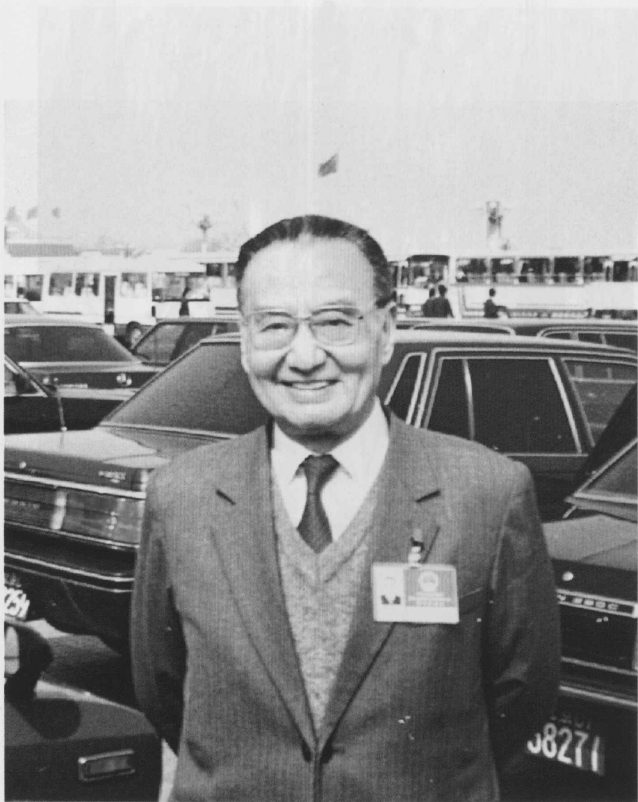
何老在北京出席第七届全国人民代表大会