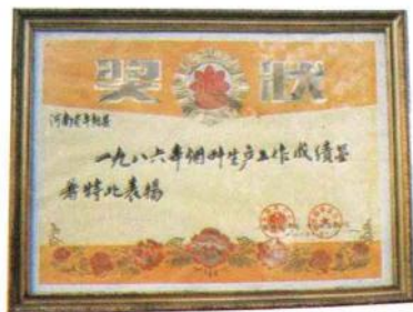
1986年中国烟草总公司授予舞阳的奖状。