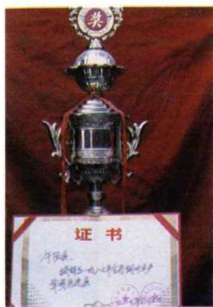
▲一九八七年获河南省人民政府烟草生产先进县奖杯