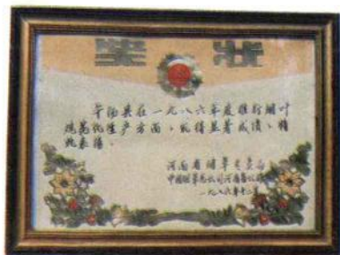
河南省烟草公司授予舞阳的奖状