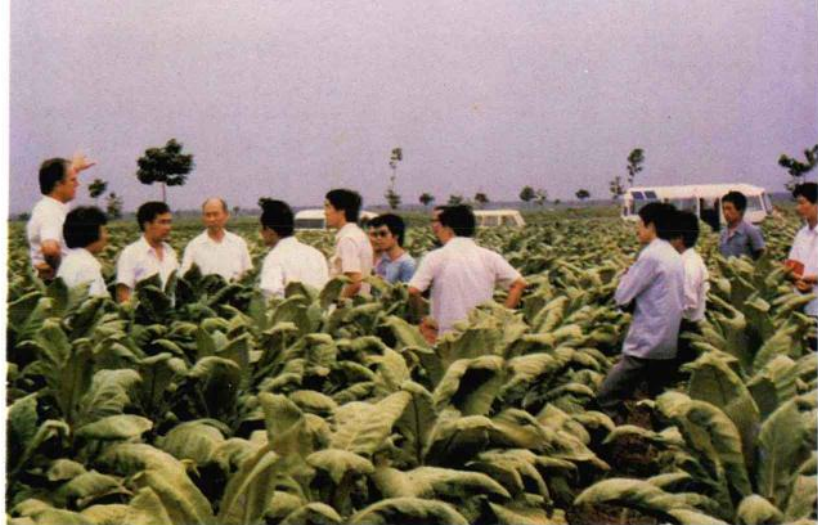
▲1985年8月，美国奥斯汀烟草公司副总裁范士等来舞阳考察优质烟示范田