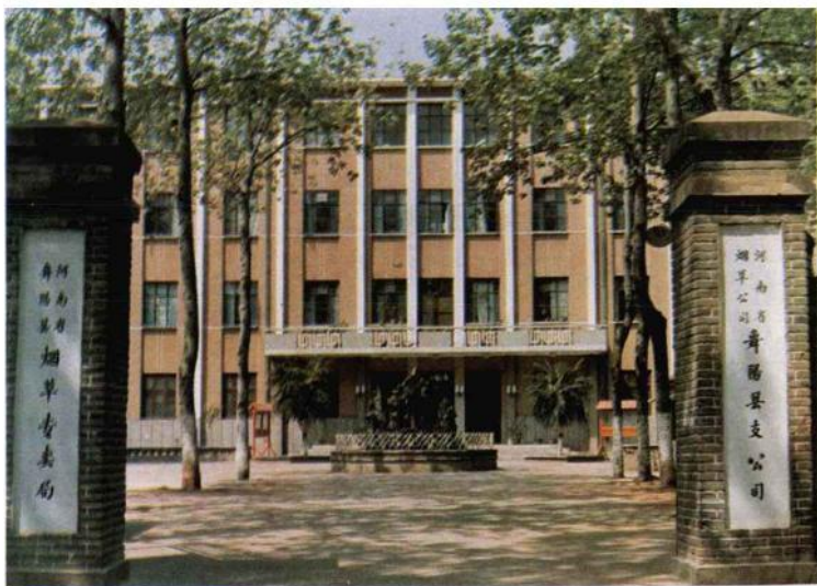
▲舞阳烟草支公司生产、经营、科研决策中心