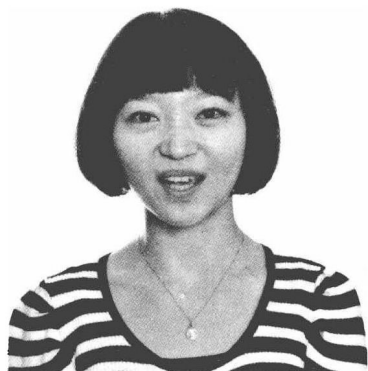
与人谈话时，瞳孔扩大到比平常大四倍

如果你与一个人谈话时，对方的瞳孔扩大到比平常大四倍。这就表明此人正感到愉悦、喜爱、兴奋。