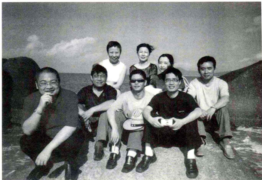
2003年，小说月报在海南的一个笔会