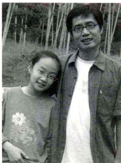
2005年6月在绍兴兰亭，和女儿