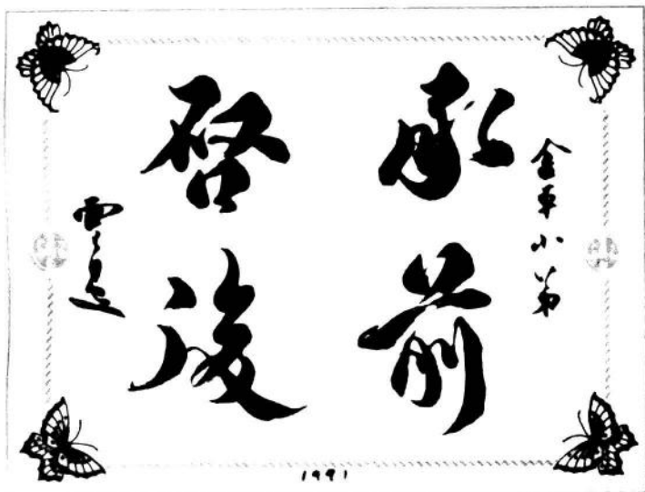
余雪彦（1907—1993）教育部部聘教授、当代著名学者、书画家，出版文学丛书、美术丛书、画册、字帖逾百种，有日、法两国译本。