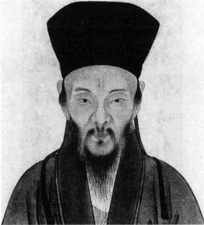
王阳明( 1472 ~ 1529 )