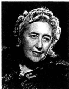
阿加莎·克里斯蒂 Agatha Christie (1890--1976)