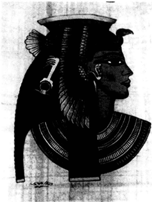
▲埃及法老头上的“鹰”和“蛇” 头饰代表上下埃及的统一

古老的埃及似乎在等待一个伟大统一者。公元前3100年左右，纳美尔出生在上埃及的提尼斯城。他成为上埃及王国的法老以后，不断向外发动战争，约在公元前3100年，他征服了下埃及，使整个埃及初步统一成一个