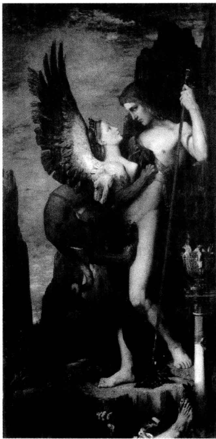
▲表现斯芬克斯之谜的名画《俄狄浦斯和斯芬克斯》

据说，埃及的狮身人面像最初是依据故事中的斯芬克斯的外貌雕刻而成的。不过，工匠们在雕刻的时候，将人面换成了哈夫拉的外貌。设计师为什么会有这样的设计思路呢？这是因为在远古的时候，酋长负责保护本部落的安全，担任抵御外来之敌的任务，人们就把勇敢的酋长比作勇猛的狮子。而且在