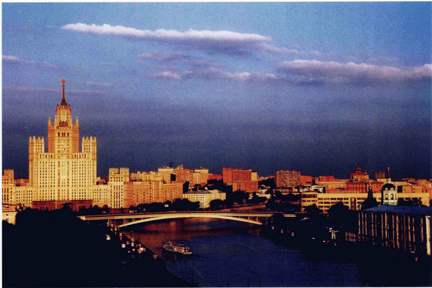
金色莫斯科 俄罗斯