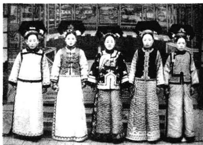
宫女如花满春殿，只今惟有鹧鸪飞。