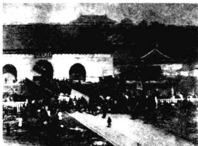
八国联军攻入大清宫门

光绪二十六年（1900年）八月十四日，八国联军攻陷北京城。十五日凌晨，慈禧为了保全性命，置国家危难于不顾，带着光绪皇帝和她的