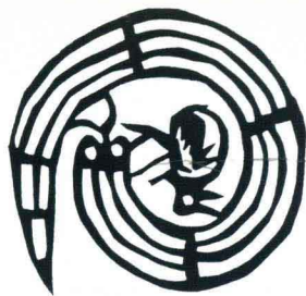
蛇盘兔 山西 9.8cm × 9.8cm

The Snake Twines round the Rabbit Shanxi 9.8cm × 9.8cm