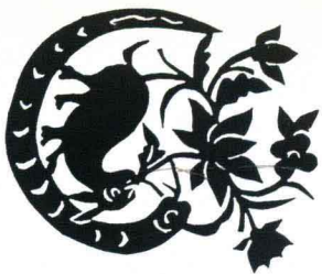
蛇盘兔 陕西延安 8.4cm × 10.6cm

The Snake Twines round the Rabbit Yan'an, Shan'xi 8.4cm × 10.6cm