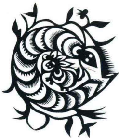
蛇盘兔 (喜花) 陕西安塞 张凤兰 18.0cm × 20.0cm

The Snake Twines round the Rabbit (happiness flower) Ansai, Shan'xi Zhang Fenglan 18.0cm × 20.0cm