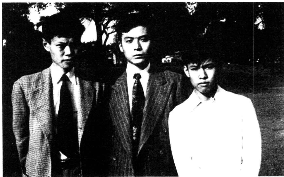
邓稼先（中）与杨振宁（左）、杨振平（杨振宁的弟弟） 1949年在美国的合影。

这个人，这个人又做得很成功。你问我他有些什么特点使我觉得他会这么成功？那我觉得很简单：他的一个非常大的特点，在我们做学生的时候就已经很清楚了，就是他在任何场合之下，都会使人觉得这个人是一个没有私心的人。稼先是一个很聪明的人。不过，我想他的最重要的特点是他的诚恳的态度，是他不懈努力的精神，以及他对中国的赤诚的要贡献他的一切的这个观念。我想，他受命于中国政府要造原子弹、氢弹，根据我对稼先的认识，我可以想象到，他就是全力以赴的。而且他有一个很重要的特点，我想很少有人能做到的，就是他能够使得他的手下，百分之百地相信，邓稼先是为着公而不是为他自己。也因为这样，他们尊敬他，而且能够仿效他尽量去掉私念，而以整个中国国防事业为他们最重要的目标。我想，这是稼先他的个性和特长。 ——杨振宁