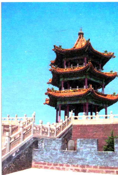
图1-7 华盖山栖凤公园凤鸣阁

此外，20世纪90年代，宁武县人民政府还在华盖山上规划建成了占地60公顷的栖凤公