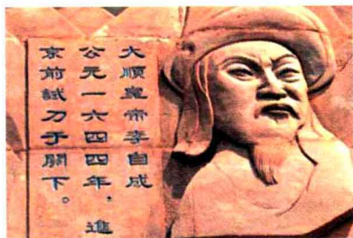
图1-4 大顺皇帝李自成像

但是，所有这一切都未能使明王朝免遭灭亡的命运。相传，当年闯王李自成“倒取宁武关”时，曾站在禅房山朔宁堡远望关城，正好望见护城墩