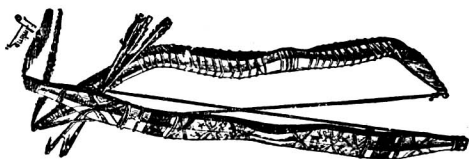
西北部印地安種的弓矢(此圖在Ratzel民種學第二冊625頁)