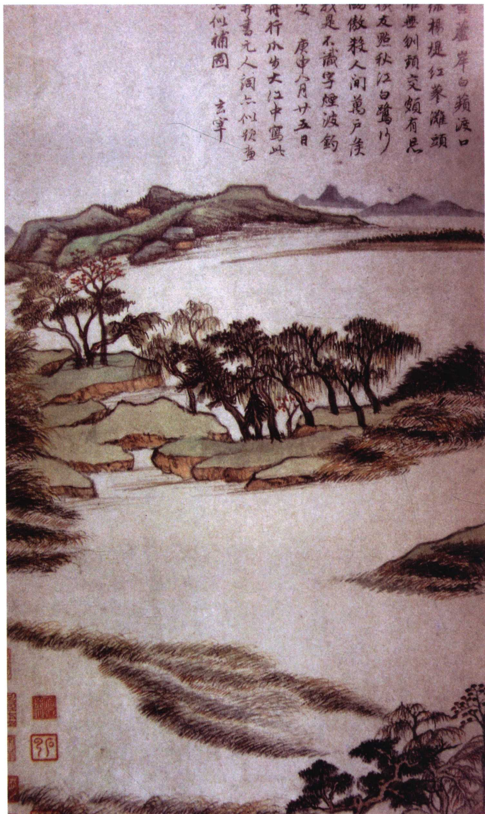
▲ 明·董其昌《秋兴八景图册》