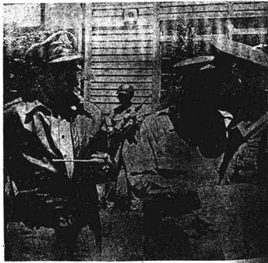
(感堂一足不履火砲在)察視機前轉兩往月九廿月六論