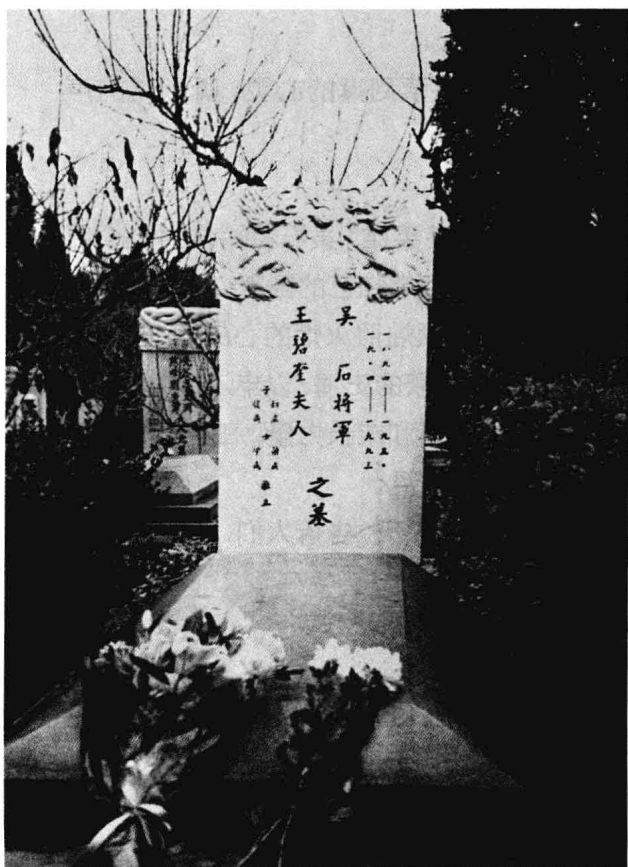
此地安息着一位影响历史的英雄

2004年9月的一天正午，天空一片湛蓝，阳光普照大地。在北京出差的我驱车赶到香山公墓，特地寻访吴石将军墓地。我按照吴石将军子女提供的墓碑号寻去，在一片墓冢里终于看到一座庄严的汉白玉墓碑。找到