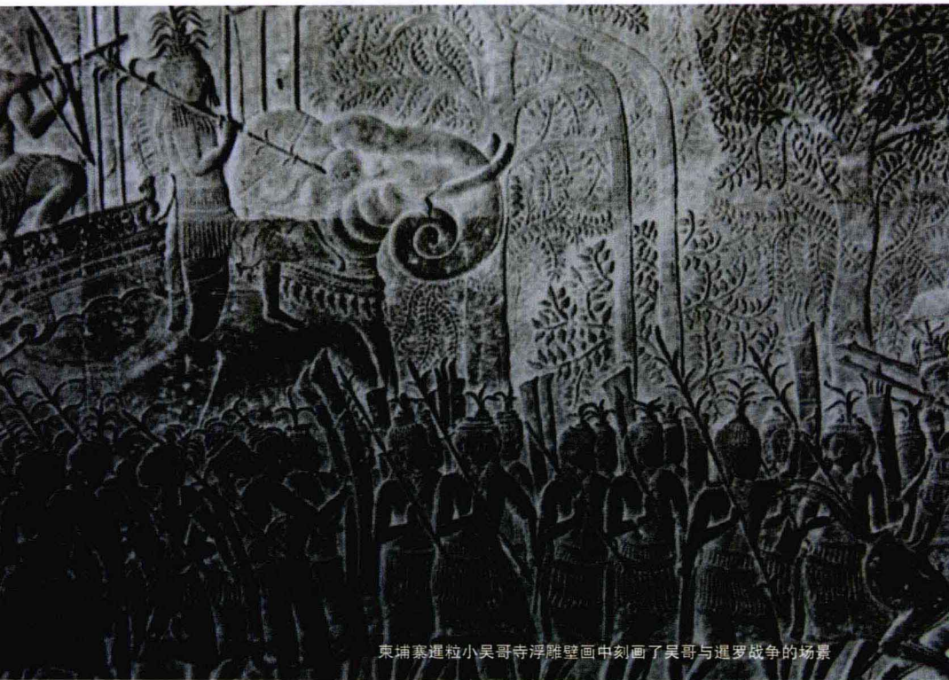
柬埔寨暹粒小吴哥寺浮雕壁画中刻画了吴哥与暹罗战争的场景

在东南亚地区，泰国一直都有着举足轻重的地位，又是东盟的创始国之 在积极政策的激励下，经济迅速发展，一跃成为“亚洲四小虎”之一。直到 1997 年金融危机的重击，泰国经济一度陷入低迷状态。随着 2006 年的军事政 变到 2008 至 2009 年泰国的政治危机，旅游业也随之受到影响。但无论如何， 泰国旅游业的发达程度，在东南亚是首屈一指的。