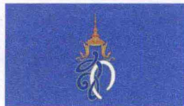
6. 代表泰国王后的旗帜