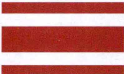
5. 六世王采用红色和白色相间的旗帜