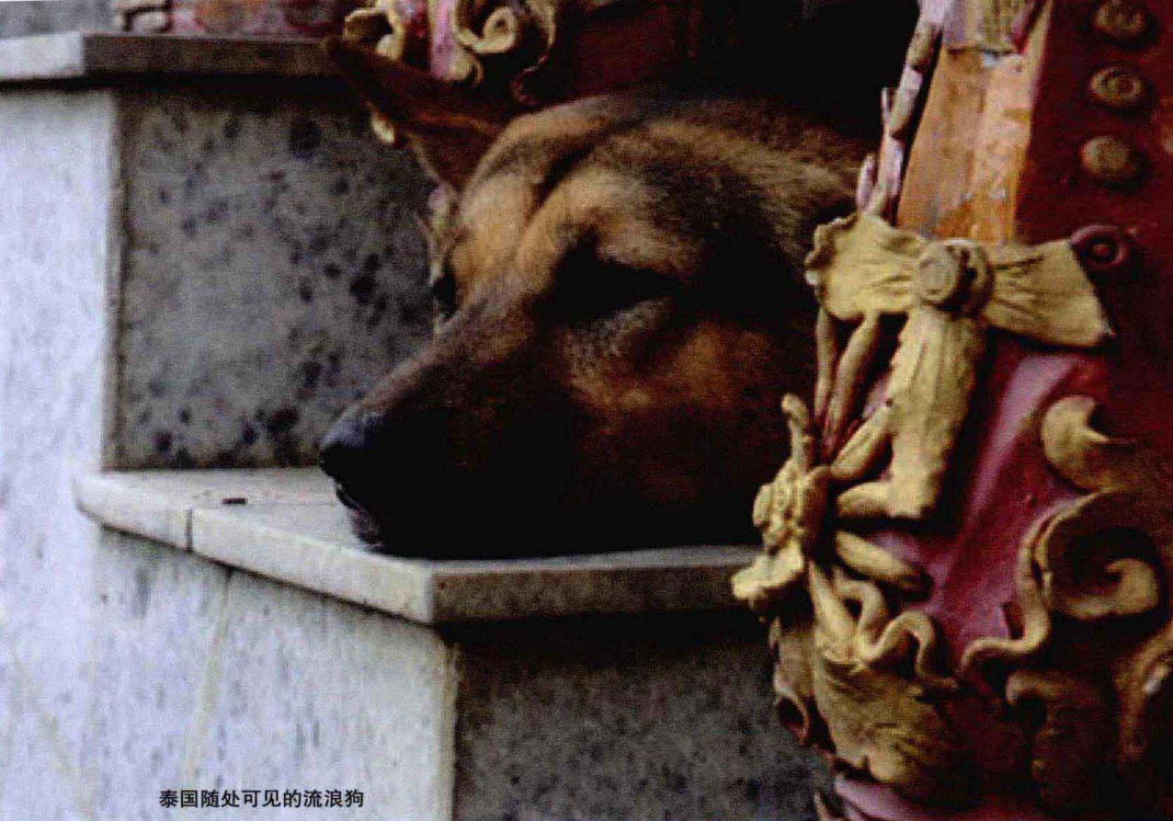
泰国随处可见的流浪狗