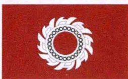
2. 1790~1820年曼谷王朝使用的法轮旗