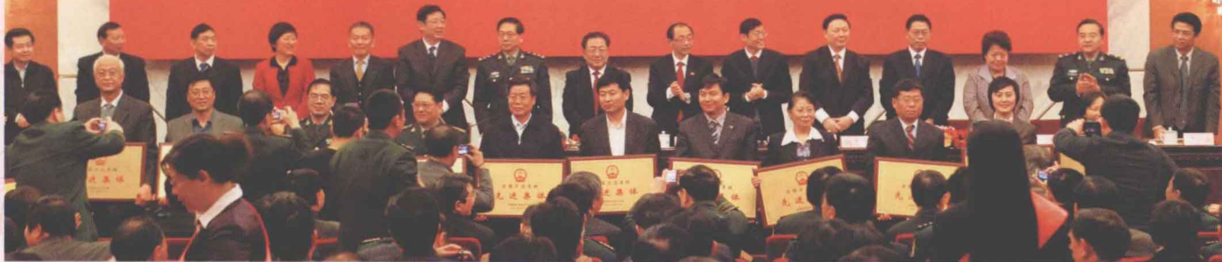
▲ 先进集体代表上台领奖。