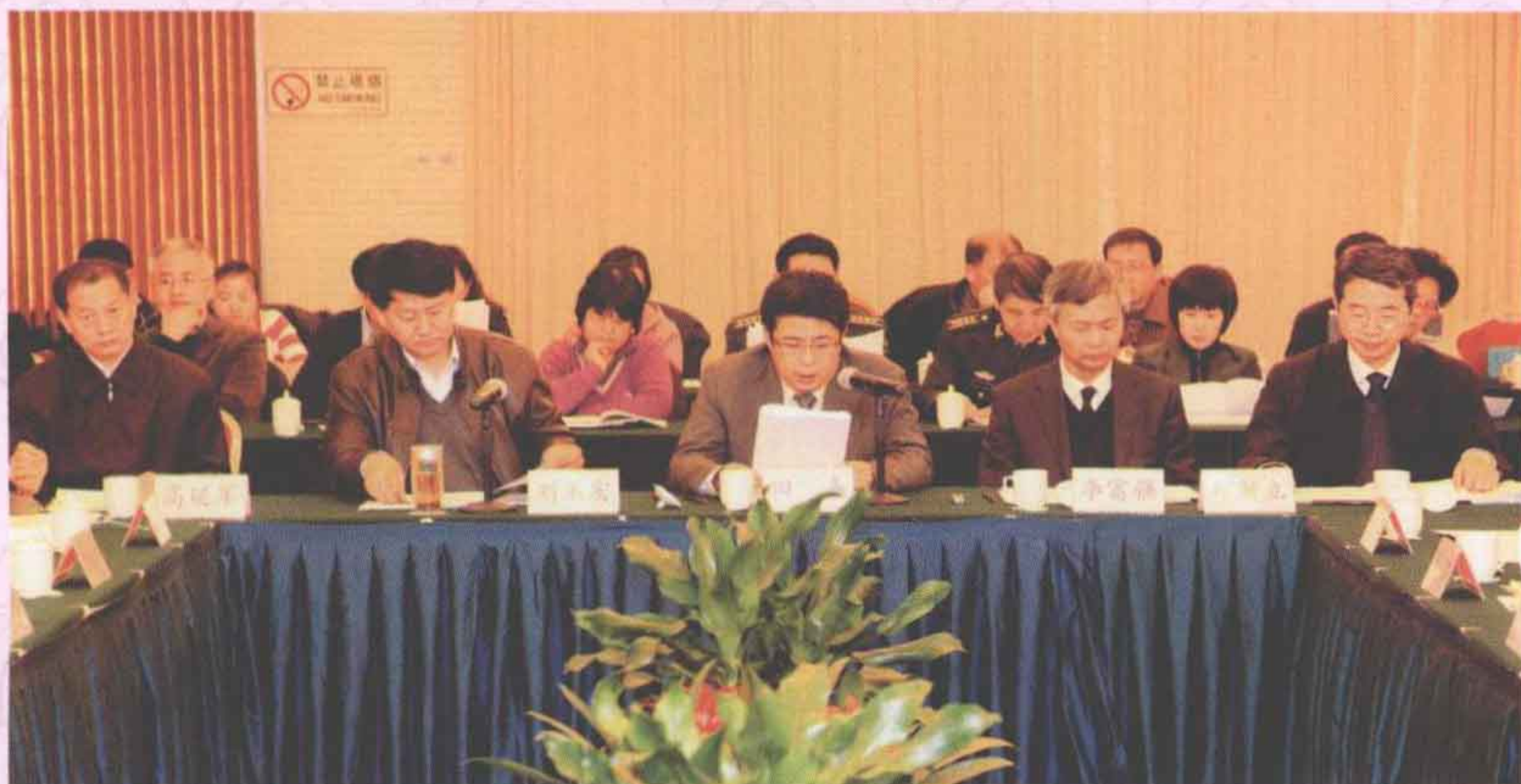
◀ 参加中国地方志指导小组四届二次会议的部分代表。