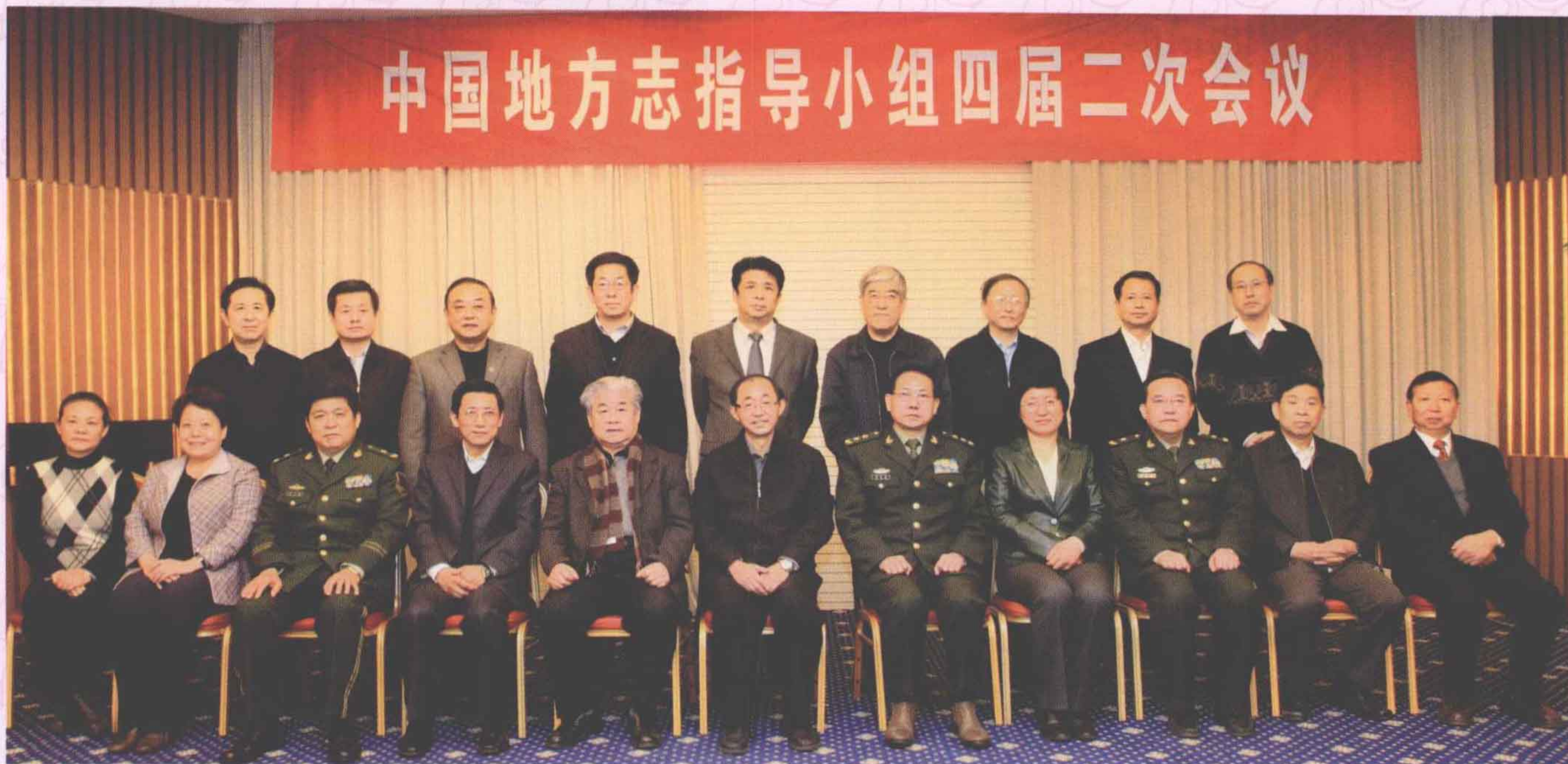
▲ 中国地方志指导小组四届二次会议与会代表合影。