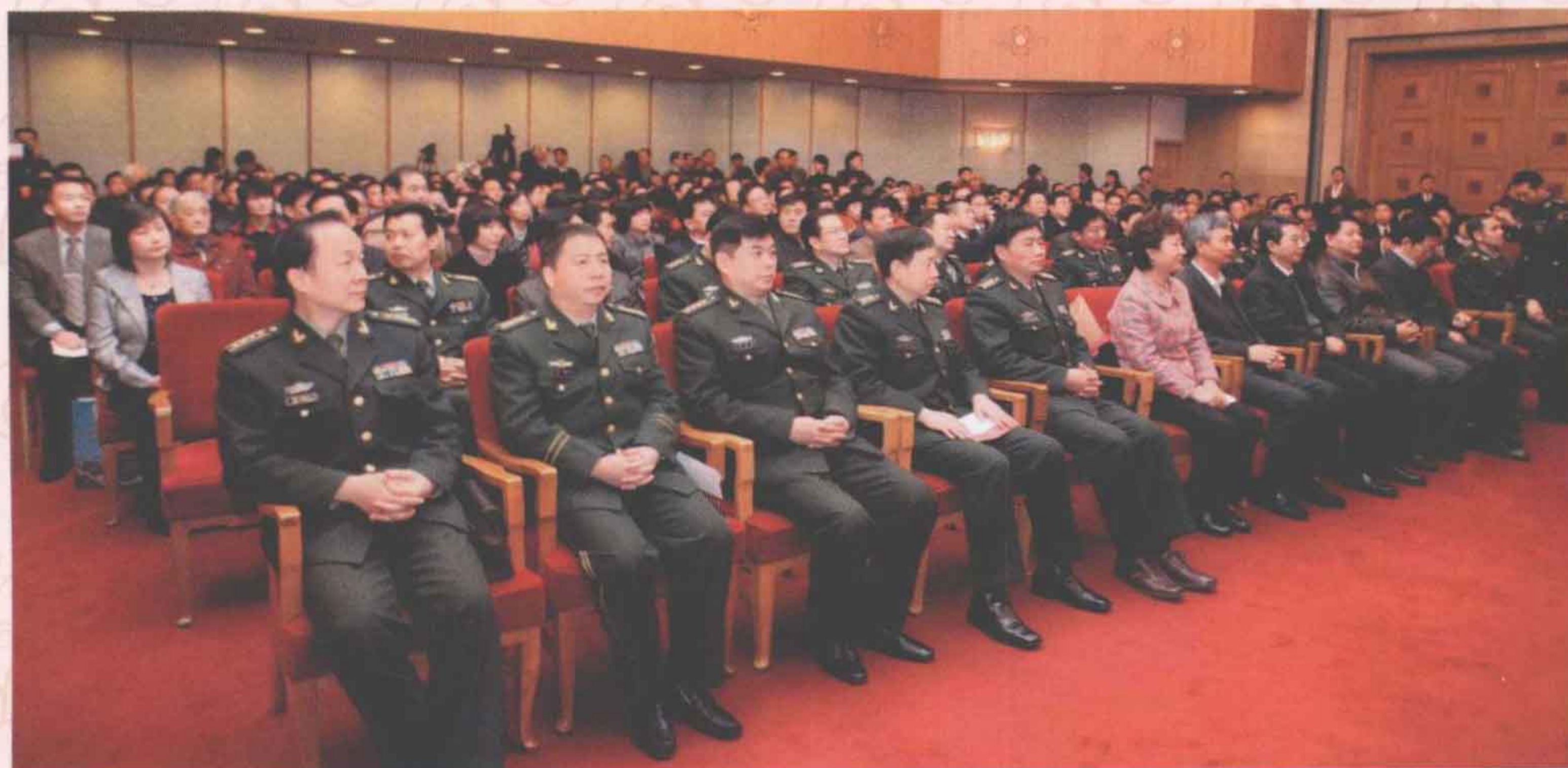
◀ 全国地方志系统表彰先进大会会场。