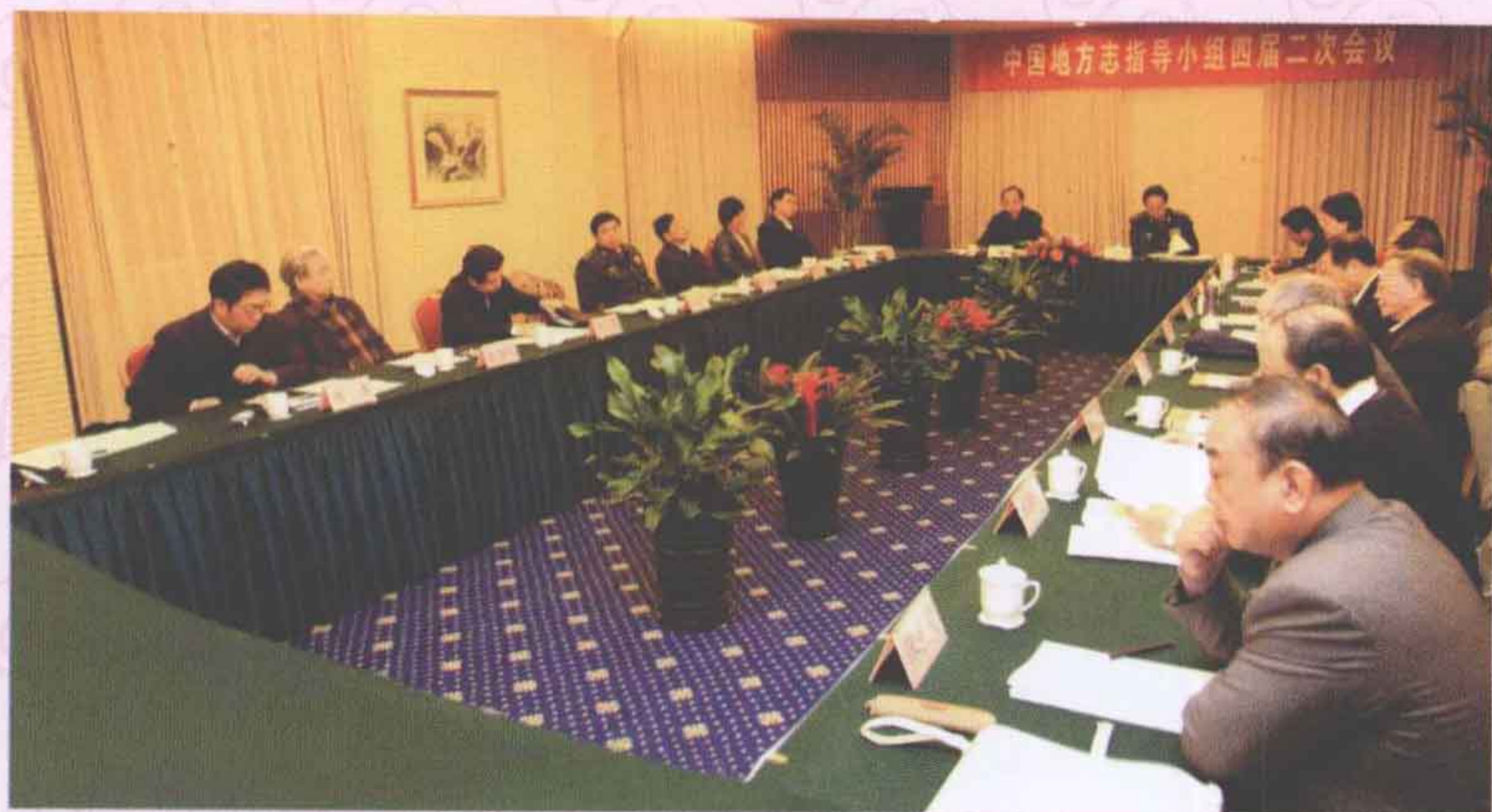
◀ 中国地方志指导小组四届二次会议会场。