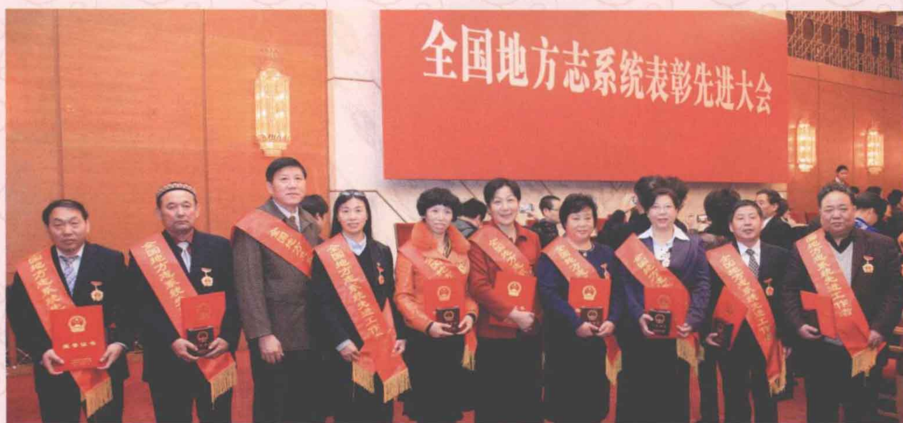
▶ 10名全国地方志系统先进工作者合影。