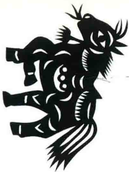
马 陕西延安 13.4cm × 9.8cm

The Horse Yan'an, Shan'xi 13.4cm × 9.8cm