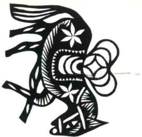
马驮宝 陕西安塞 8.3cm × 7.6cm

The Horse Carries the Treasures Ansaï, Shan'xi 8.3cm × 7.6cm