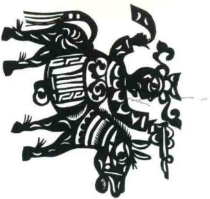
骑兵 陕西安塞 常振芳 17.0cm × 15.8cm