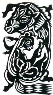
怀马女的母马 陕北延川 21.6cm × 11.8cm

The Pregnant Horse Yanchuan, Shan'xi 21.6cm × 11.8cm