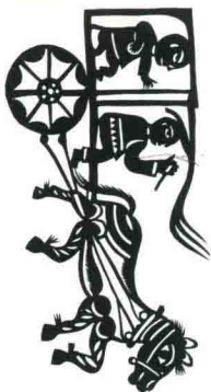
马拉车 (墙花) 陕西安塞 常振芳 27.5cm × 13.5cm

The Horse Draws the Carriage (wall decoration) Ansai, Shan'xi Chang Zhenfang 27.5cm × 13.5cm