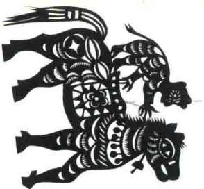
猴骑马 (墙花) 陕西安塞 潘常旺 17.0cm × 17.0cm

The Monkey Rides the Horse (wall decoration)